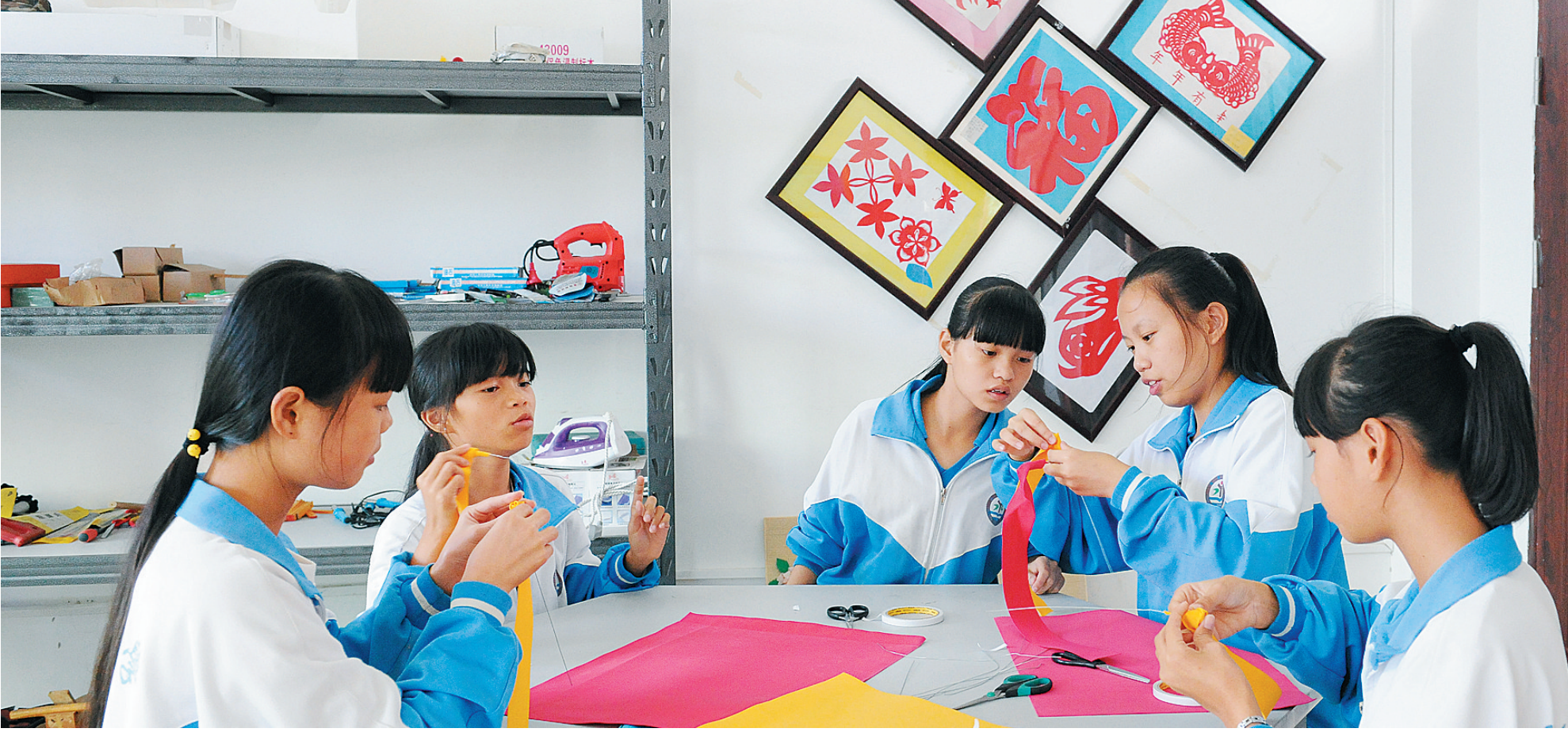
澄迈县永发初级中学初二学生在校内活动室进行剪纸作品创作。