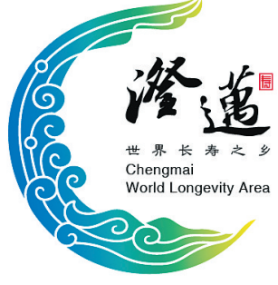
正在公示的澄迈城市形象标志。

本报金江11月2日电(记者陈卓斌)记者今天从澄迈县委宣传部了解到,澄迈城市形象标志征集评选工作已经结束,目前已进入公示阶段。据悉,公示时间为10月30日至11月4日,公示期间如有异议,澄迈县将专门组织评审专家进行重新认定鉴别。