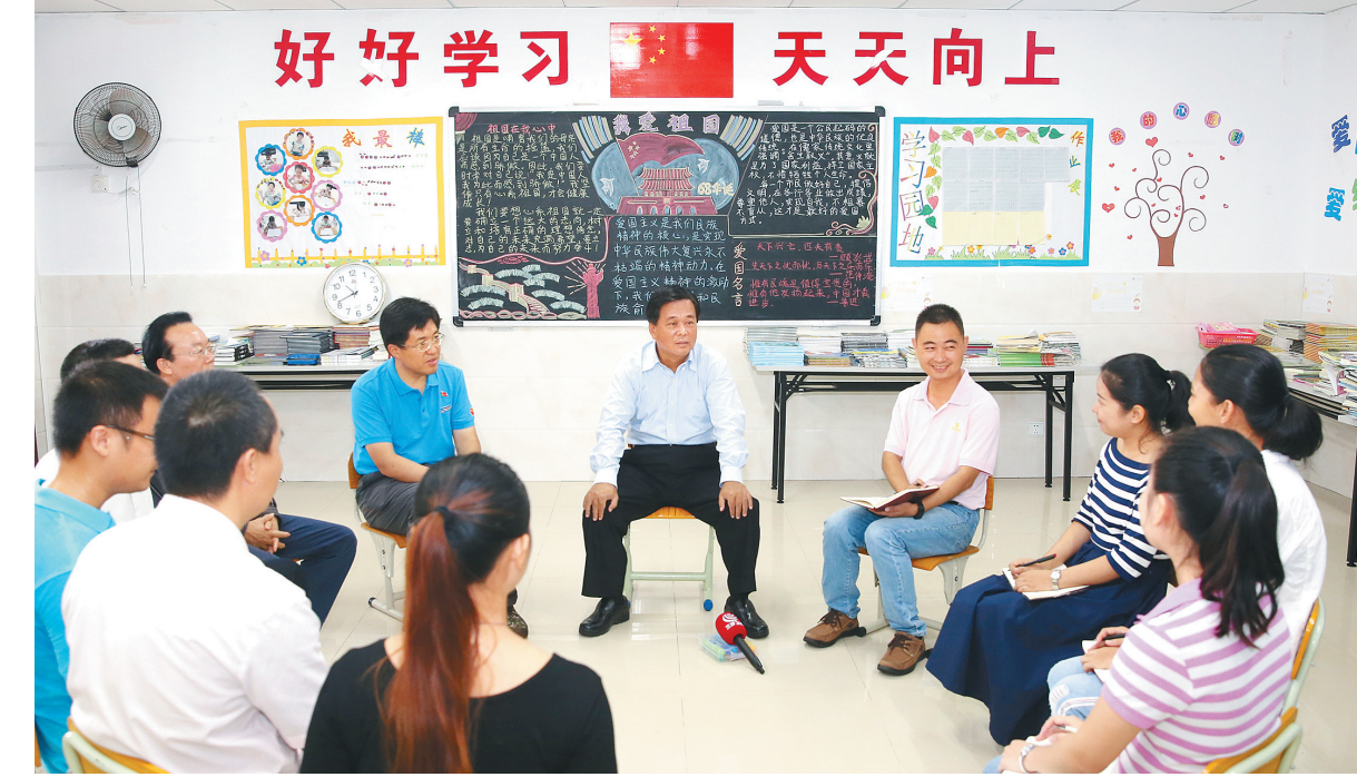
11月6日，十九大代表、三沙市委书记田湘利（右五）来到三沙市永兴学校，开展党的十九大精神“进校园”宣讲活动。

本报永兴岛11月7日电（记者刘操 通讯员宋起来）“十九大报告提出要加快建设海洋强国，永兴学校作为一所海岛学校，要办出海洋特色、岛礁特色。”11月6日上午，党的十九大代表、三沙市委书记田湘利来到三沙市永兴学校，开展党的十九大精神“进校园”宣讲活动。 在永兴学校二楼教室，田湘利与老师们围坐在一起，向大家宣讲党的十九大精神，分享学习心得与体会。他说，党的十九大是在全面建成小康社会决胜阶段、中国特色社会主义进入新时代的关键时期召开的一次十分重要的大会。作为学校的老师，既要学习掌握十九大精神，也要宣传十九大精神，更要践行十九大精神。 田湘利说，习近平总书记对教育非常重视，在十九大报告中提出“必须把教育事业放在优先位置，深化教育改革”。这几年，我国教育事业取得长足发展，在偏远岛礁上建成一所学校，非常不容易，具有标志性意义。这也印证了习近平总书记十九大报告中说的“五年来的成就是全方位的、开创性的”。 “希望各位老师对十九大报告关于教育发展的内容多学习、多思考，联系教育实际，深学、细悟、笃行，为‘幼有所育’‘学有所教’作出应有的贡献。”田湘利表示。 田湘利说，十九大报告中对生态文明建设作出了战略部署。生态文明建设要“从娃娃抓起”，这和教育工作密切相关，是老师们义不容辞的责任。永兴学校的老师要充分发挥自身优势，帮助政府在提升渔民、居民的文明素质上多作努力。“目前永兴岛正在推行垃圾分类，学校可以教学生如何进行垃圾分类，