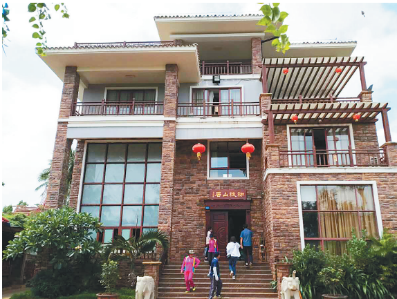
演丰镇山尾村枷槌山居民宿。

枷槌山居民宿打工,主要负责清洁工作,为家庭增加了收入。 此外,演丰镇政府还鼓励精准扶贫建档立卡户通过入股的形式,参与到当地民宿等旅游产业中,使得当地贫困户收入有了明显提升。其中,共有12户建档立卡贫困户在演丰镇政府的帮扶下,通过贷款入股枷槌山居民宿,每年获得的固定回报率达到了12%。