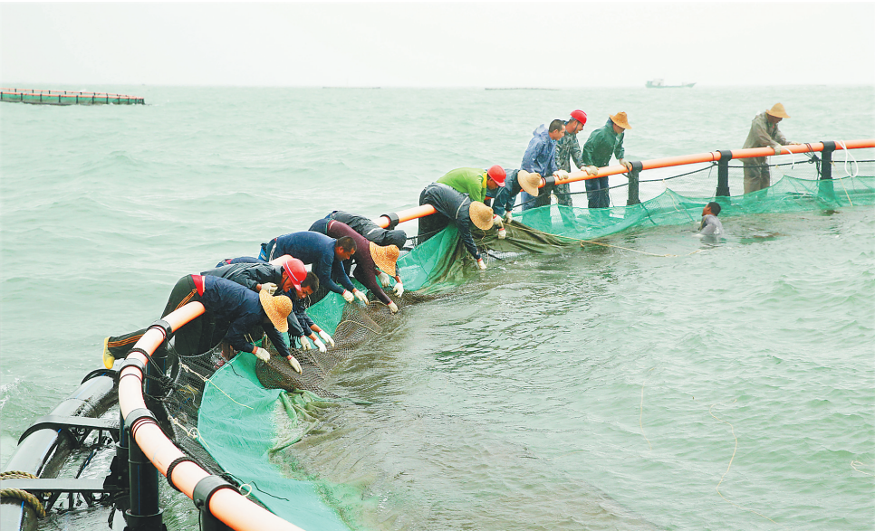
工人正在给深海网箱加装护网。