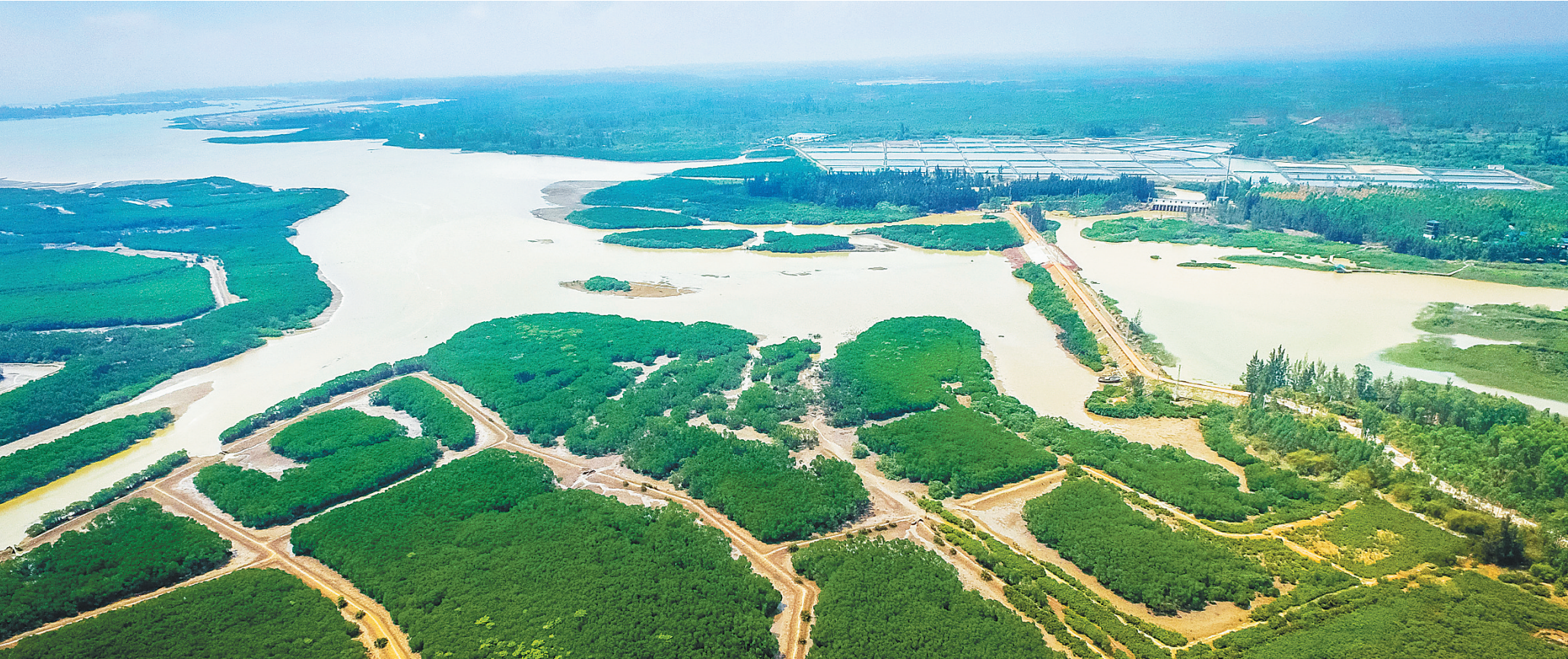
临高县新盈镇红树林。