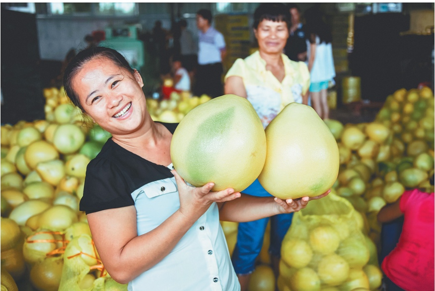
临高县美台头星红心蜜柚种植基地种植的蜜柚供不应求。