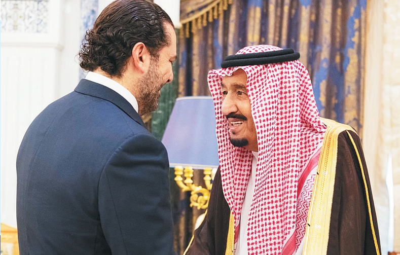
近日，沙特国王(右)会见黎巴嫩前总理萨阿德·哈里里。

分析人士指出，沙特内政与外交向来联系紧密，沙特领导人实际上是在国内和国际两块棋盘上同时下棋。眼下叙利亚战局向有利于伊朗的方向变化，为遏制这个老对手，扩大地区影响力，沙特在也门、黎巴嫩等多条战线同时出击。