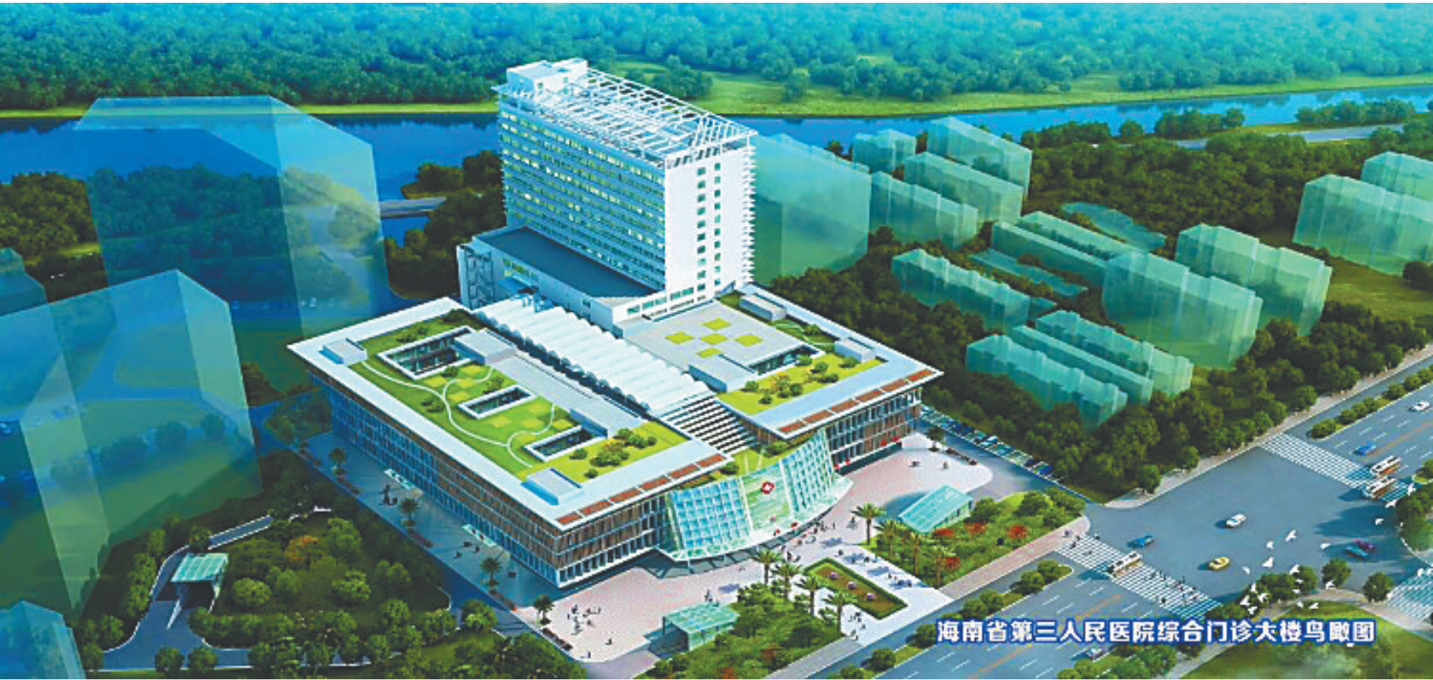
海南省第三人民医院综合门诊大楼鸟瞰图

今年10月31日晚,在海南省第三人民医院(下称省三院)的一处广场上,灯火辉煌,热闹非凡。这个晚上,省三院的几代职工汇聚一堂,庆祝医院55岁华诞。在这个夜晚,人们向为医院搭建基石的老职工们致敬,并展望医院新的未来。 55年前,在国家的战略部署下,黑龙江省850农场医院的101名职工奔赴海南,在三亚建设当时海南南部第一所正规医院。 在半个世纪的风风雨雨中,省三院两度迁址、体制和名称几度变更,但在医院历届党委和医务人员的共同努力下,始终坚持和加强共产党的领导,坚持为人民服务、为病人服务的宗旨,坚持改革开放和科学发展,在战胜困难中前进,在竞争中求得发展,医院各方面工作都取得了非凡的成绩。如今,省三院已经发展成为琼南地区唯一一家国家第一批评审通过的大型综合性“三甲”医院、国家临床药物试验基地、国家级住院医师规范化培训基地、海南省危重孕产妇救治中心、海南省危重新生儿救治中心,服务范围辐射琼南二市五县,为琼南400多万常住人口及每年近1000多万人次的过境游客提供优质医疗服务。