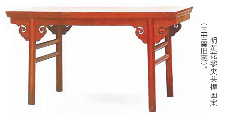
明黄花黎夹头榫画案 (王世襄旧藏)。

所以，如今的黄花黎和我理想中的黄花黎不大一样。我们需要认真思考的是，我们究竟要什么样的黄花黎？