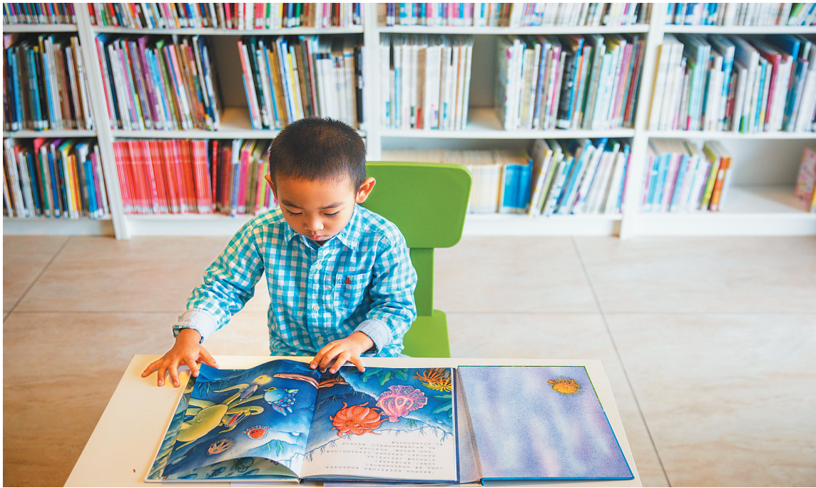
绘本教育，让孩子爱上阅读。