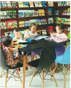
小朋友在阅读绘本。