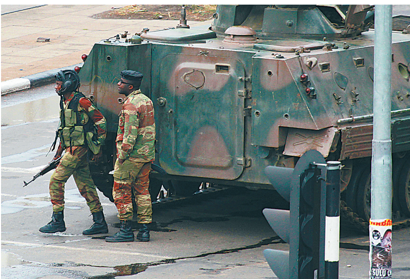
15日,士兵在通往总统穆加贝办公室的路上执勤。