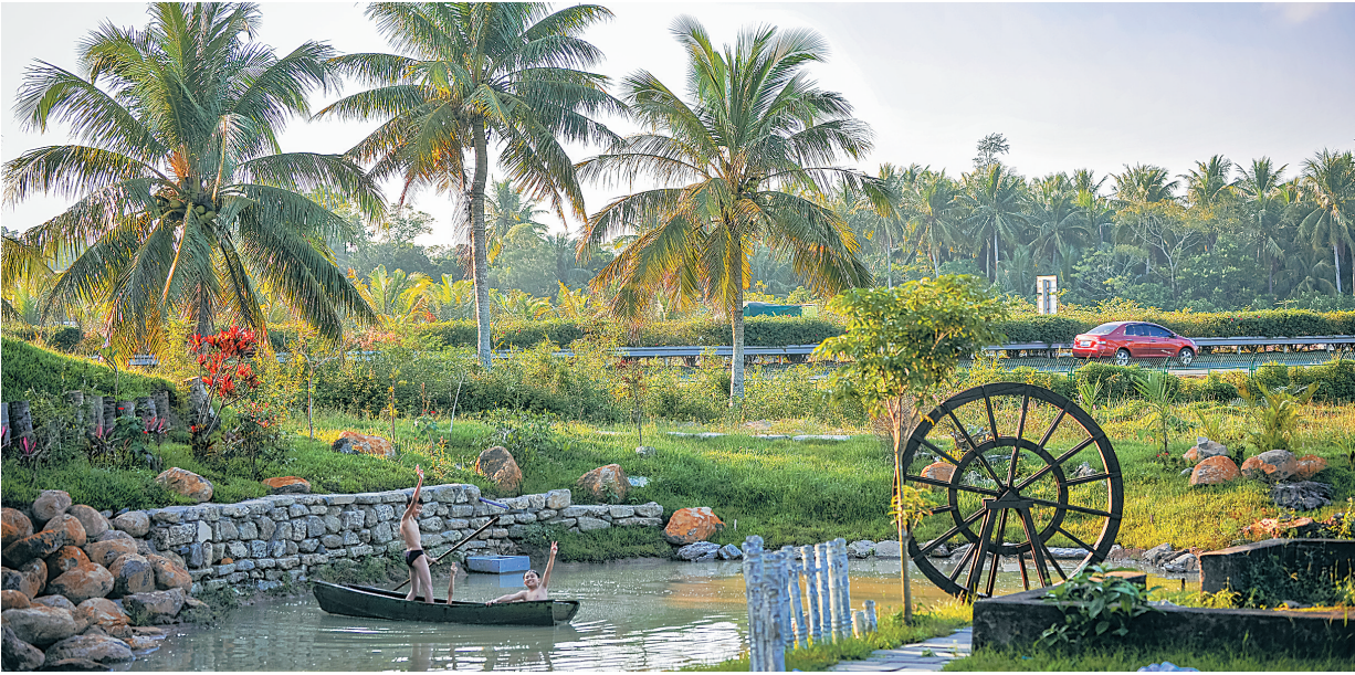
11月17日,夕阳下的文昌潭牛镇大庙村格外美丽。

“以前,我们这里只是海文高速路边的一个普通自然村,相信很快就会成为受游客青睐的美丽乡村了。”11月17日上午,在文昌市潭牛镇大庙村,55岁的村民符茂潭谈起大庙村今年的变化,一脸骄傲。今年5月,大庙村着手建设美丽乡村,在建设的过程中,村民热情高涨,不仅出钱、出力,还为村庄建设规划出点子。