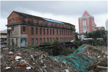
“海南医院”尚存的主体建筑的中楼。