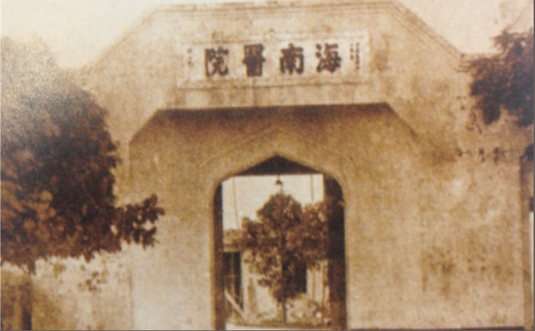
海南医院大门旧照。

2017年11月15日，海南日报记者寻访“海南医院”遗址时，只见海南省人民医院龙华院区北面的旧城改造区域，腾出了一片空旷之地，从医院大门向北望去，一栋三层高、东西走向的红色砖墙洋房，显得特别抢眼；走近一看，多数木制的百叶窗还完好无损，显得古朴端庄。与它相依的，是南北走向的一幢副楼，也是三层高，让人唏嘘旧事已过，却仍有迹可循。现在，这里作为出租铺面和仓库存在。