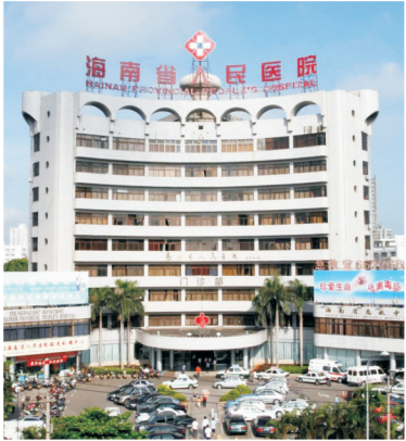
海南省人民医院龙华院区门诊大楼。