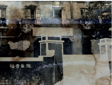
海口福音医院大门旧照。

后来，这家医院成为今海南省人民医院的一部分。其实，省医院的前身可以追溯到1881年在海口成立的一间免费诊所，诊所后来发展为“海口福音医院”。如此算来，海南省人民医院已经先后走过了136岁的历程。