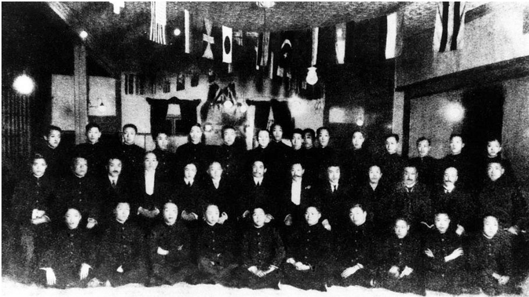
1905年,兴中会、华兴会和光复会联合成立同盟会。

此后,陶成章再度赴日,但因为与同盟会主盟之人发生矛盾而于1908年后前往南洋筹款。1909年后,在知名革命党人李燮和的支持下,陶成章撇开同盟会独自行动,其到缅甸、爪哇等地演说并将浙江革命党人事迹写成《浙案纪略》陆续发表,陶成章由此名声大振并筹得大量革命捐款。但是,陶成章的举动与同盟会方面发生龃龉。最终,陶成章、章太炎等人在东京宣布恢复光复会名号,自行其是。