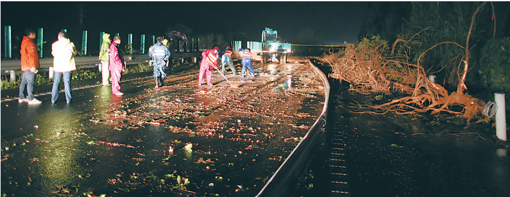
事发后，相关部门工作人员连夜抢通道路。