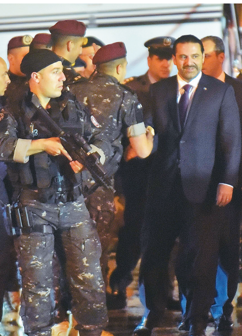
11 月 21 日，已宣布辞职的黎巴嫩总理哈里里（右）抵达黎巴嫩贝鲁特国际机场。