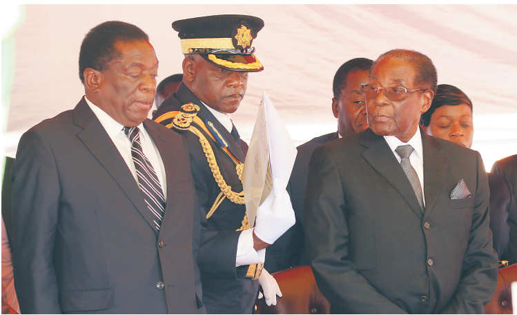
穆加贝(前右)和姆南加古瓦(前左)出席活动的资料照片。