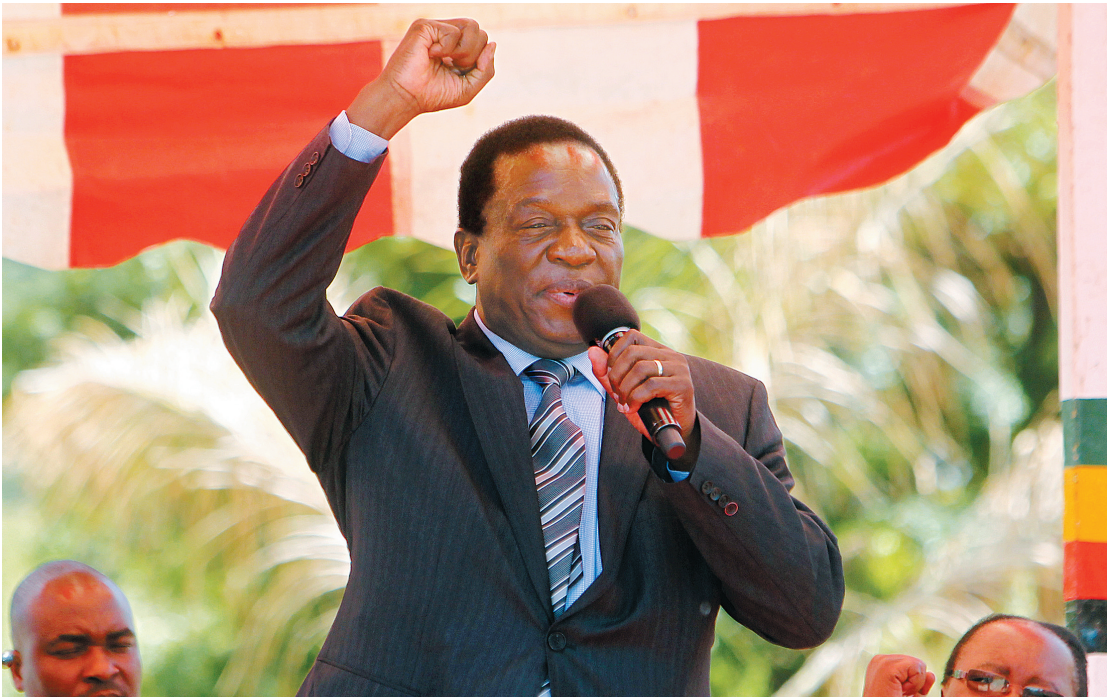
姆南加古瓦资料照片。

联合会议上宣读了穆加贝的辞职信。当时，两院议员们正在辩论对穆加贝的弹劾动议。随着穆加贝的辞职，弹劾动议自动终止。穆加贝在辞职信中表示，自己的辞职决定是自愿的，出于对津巴布韦人民福祉的关心，他希望能够确保平稳、和平和非暴力的权力过渡。 民盟发言人西蒙·卡亚·莫约 21 日向媒体表示，执政党向穆加贝致以敬意，“人们必须承认，穆加贝为津巴布韦的民族独立事业和社会经济发展做出了许多贡献”。 姆南加古瓦现年 75 岁，深得军方支持，曾被视为穆加贝最可能的“接班人”。本月 6 日，穆加贝将姆南加古瓦解职。姆南加古瓦随后发表声明称已离开津巴布韦。 本月 19 日，民盟举行中央特别会议，决定解除穆加贝的民盟主席兼第一书记职务，由姆南加古瓦接任。