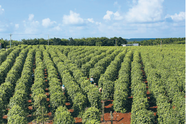
大坡镇的胡椒基地。

近日,中央文明办公布第五届全国文明村镇名单,海口市琼山区大坡镇名列其中。这是继三门镇镇和红旗镇之后,琼山区第三个获此殊荣的乡镇。 湖泊、田园、繁花、碧草……走入海口市琼山区大坡镇的田野乡间,美丽的自然风光展现在眼前,仿佛置身画中。可就在几年前,这里的面貌并非如此。