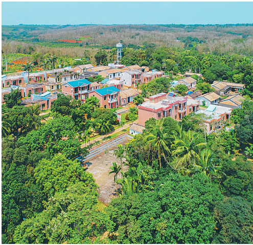
鸟瞰绿树环抱的塔昌村。

污水处理,一直是农村污水治理的难点。经过几个月的研究和尝试,近日,海口在琼山区大坡镇塔昌村建成第一个农村污水处理示范点。 据悉,大坡镇塔昌村污水收集与处理工程是琼山区今年打造的农村污水处理示范点,也是建设美丽乡村配套项目。该项目自今年5月10日启动,目前完成了化粪池修复、管网铺设、厌氧调节池、曝气生物膜反应池、人工湿地等建设。 海口大坡镇塔昌村是革命老区村庄,由于地理位置偏远,基础薄弱,污水处理问题过去一直没有得到解决,村民的生活污水直接排放,或者经化粪池处理后地下渗透,对当地土壤、地下水资源以及村民生活造成一些不良影响。 琼山区环保部门介绍,今后塔昌村的污水经过系统处理后,排出去的水可达城镇污水处理厂污染物排放标准中的一级A标准,可作城镇景观用水或一般回用水用于农业灌溉等用途。下一步,海口将把污水治理试点工作在其他文明生态村陆续铺开。