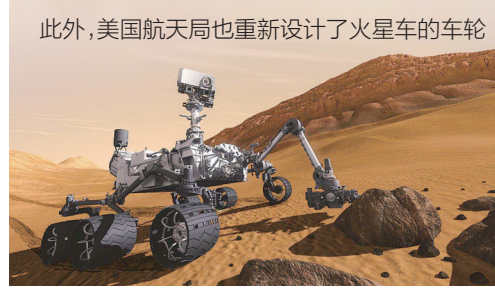
此外,美国航天局也重新设计了火星车的车轮 (据新华社华盛顿11月28日电) 制图/张昕