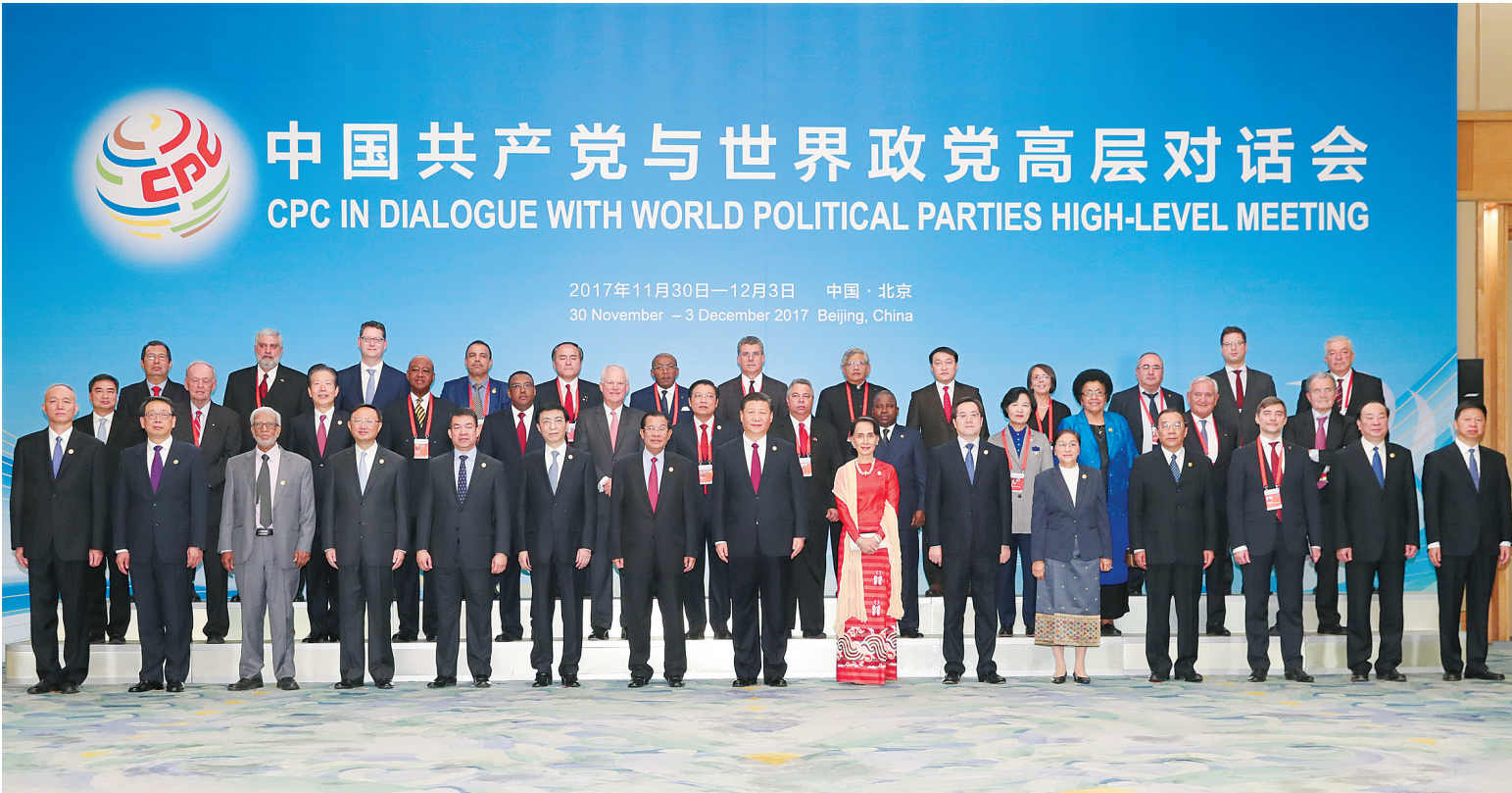
12月1日,中共中央总书记、国家主席习近平在北京人民大会堂出席中国共产党与世界政党高层对话会开幕式,并发表题为《携手建设更加美好的世界》的主旨讲话。这是开幕式前,习近平与外方主要嘉宾合影留念。