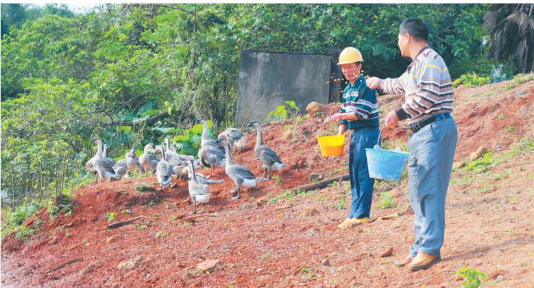
海口市秀英区长流镇长南村贫困户在喂鹅。

李宗日提到的公司是海南锦绣实业有限公司。长流镇政府主任科员柯景秀告诉记者，贫困户发展种植、养殖业缺乏技术和资金，只能单打独斗。为了激活贫困户的造血功能，该镇在常规帮扶的基础上，利用帮扶资金入股企业、成立合作社，打造“企业+合作社+贫困户”扶贫模式。 据了解，今年7月，长流镇将长