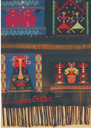
融入现代元素的黎锦作品。