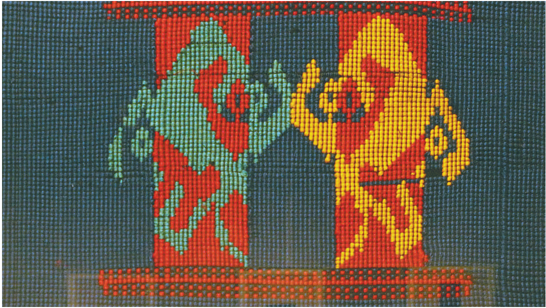
黎锦人才培养项目成果展作品。

54幅纹路清晰、色彩艳丽的黎锦作品,在柔和的灯光下散发出质朴而不失优雅的历史风韵,传递着厚重又不乏灵动的艺术气息。