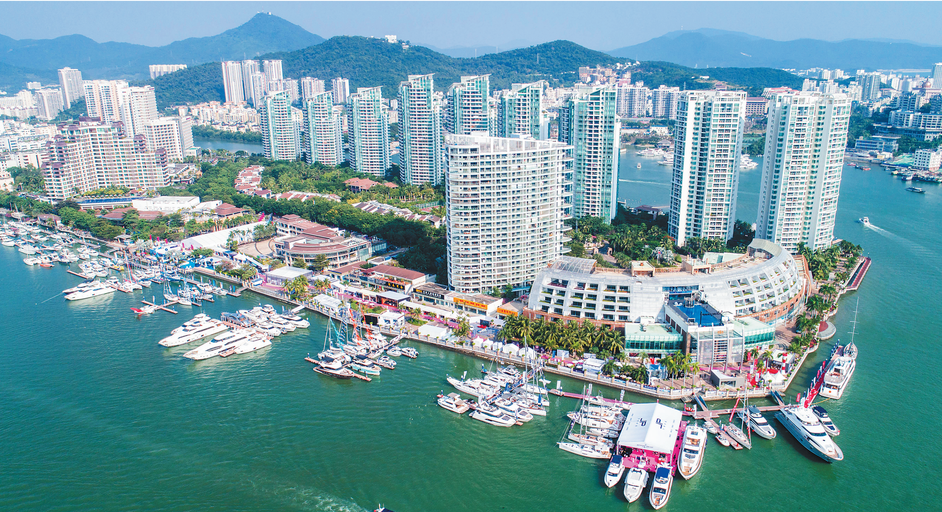
12月8日,“海天盛筵——2017第八届中国游艇、航空及高端时尚生活方式展”在三亚启幕。