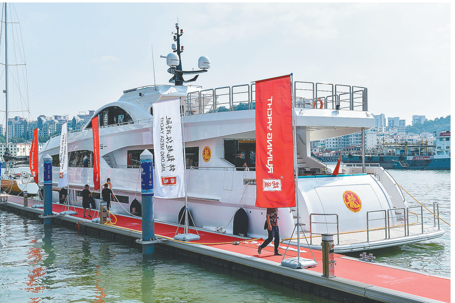
展会展出的私人订制游艇。