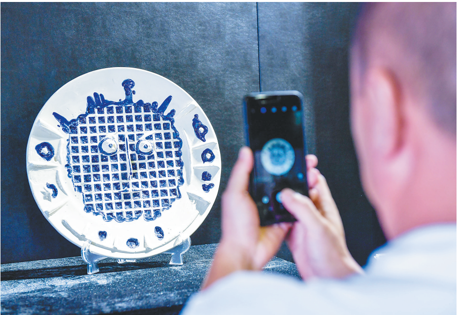
观众用手机拍摄展出的毕加索艺术品。