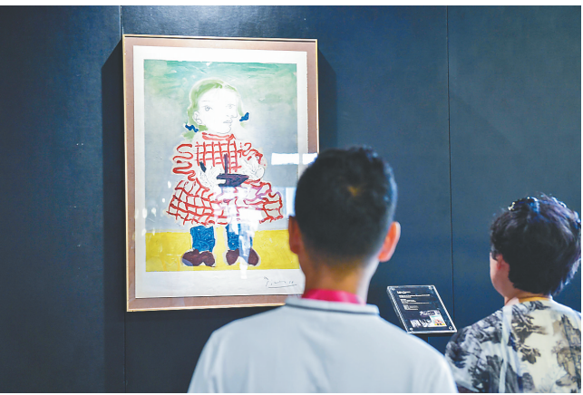
展会展出的毕加索艺术品。