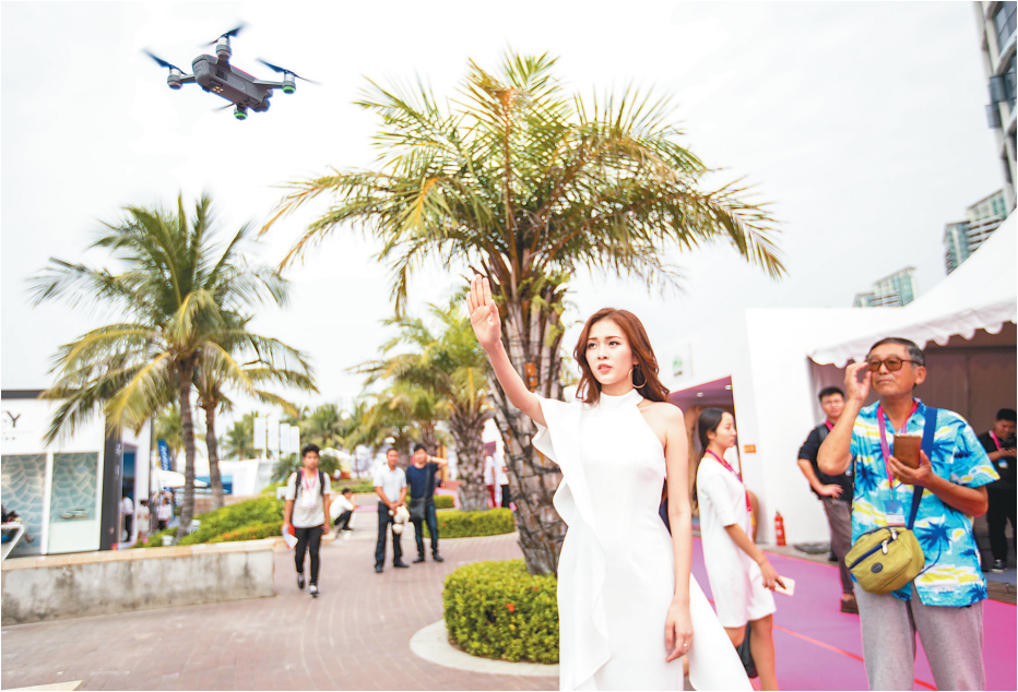
展会现场,模特在展示用手势控制无人机。