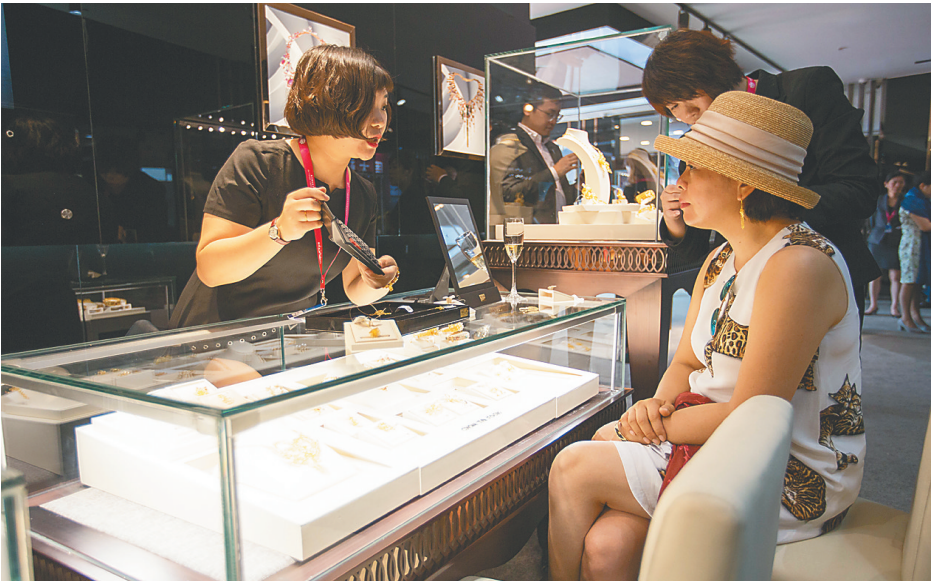
观众在选购珠宝首饰。