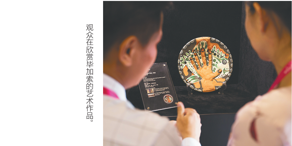
观众在欣赏毕加索的艺术作品