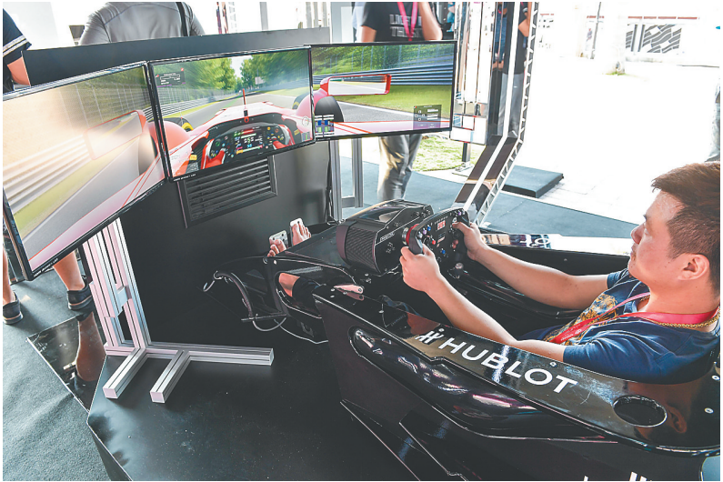
观众在展会中打模拟比赛。