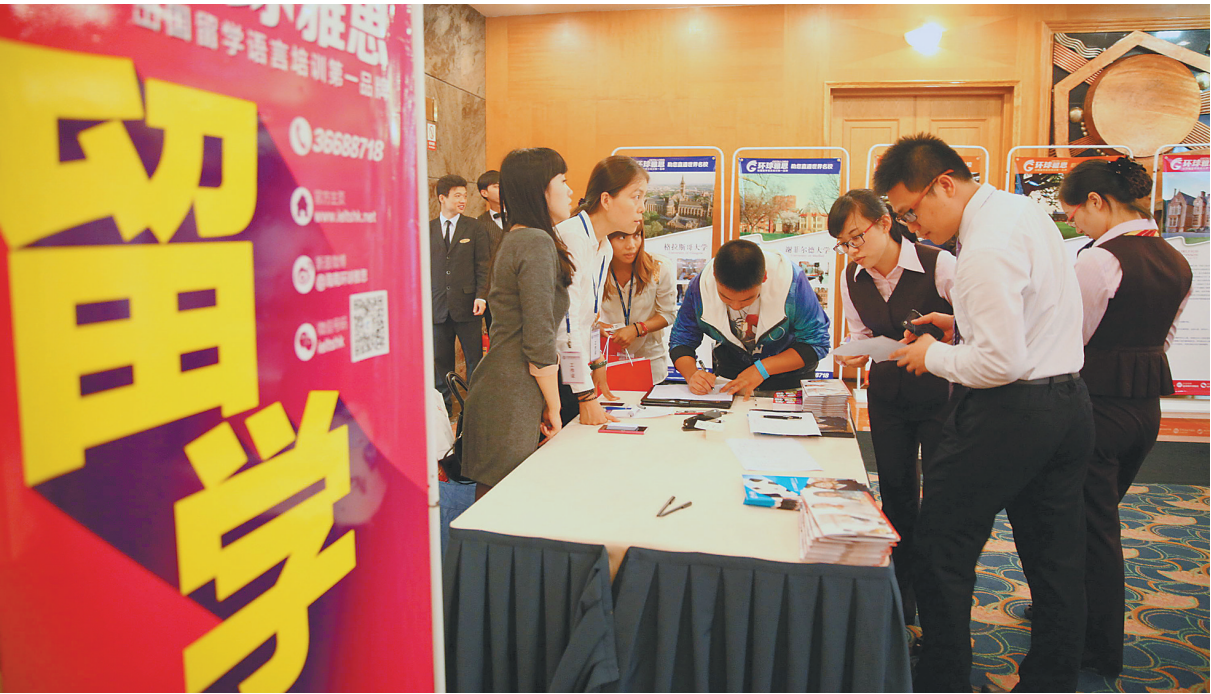
近年来,越来越多海南人将子女送到国外留学,留学低龄化趋势日益明显。

记者从省教育厅获悉,去年,我省各类出国留学人员共1035人。其中,以自费留学生和高校交换生为主,占77%。自费留学的学生群体中,近八成为到国外攻读本科及以下学历层次的人员。