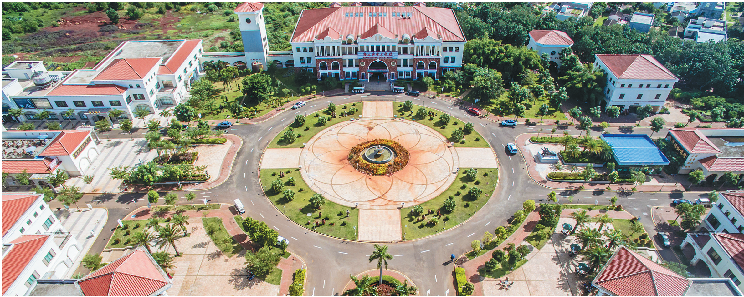
澄迈福山咖啡文化风情小镇。