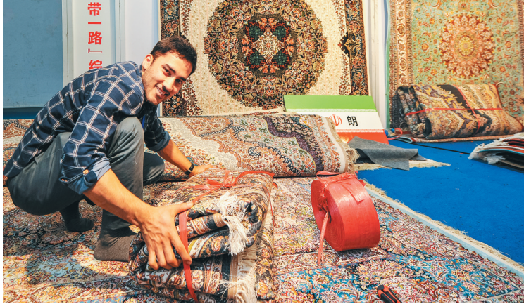
12月14日，“一带一路”国际展馆，外国客商整理卖出的毯子，脸上露出灿烂的笑容。

“海南冬交会客人多，产品销量大，我明年还要继续参展，希望能有这个机。”来自俄罗斯卡捷琳娜贸易公司的代表JIEFU说。 作为冬交会系列活动的一部分，由农业部与海南省人民政府主办的第四届中非农业合作研讨会12月11日在海口召开，120多名国际嘉宾及友人参加了此次研讨会，与会人员作为嘉宾参加了第20届