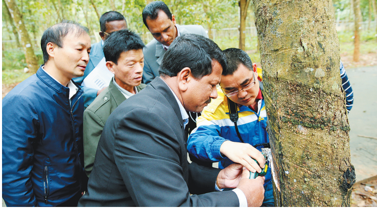
12月13日，出席本届冬交会的斯里兰卡南方省代表团赶到儋州中国热带农业科学院橡胶研究所速生丰产示范基地考察，当场就新型电动割胶技术及林下资源利用等达成初步合作意向。