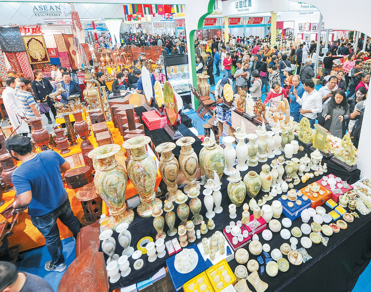
“一带一路”国际展馆，琳琅满目的工艺品吸引大量人气。

本报海口12月14日讯（记者宗兆宣）几位黑皮肤的非洲小伙打起了手鼓、跳起了欢快的舞蹈，现场推销非洲纯天然乳木果油；而在不远处，几位越南姑娘在用蹩脚的中文介绍越南的猫屎咖啡及各类食品……走进第20届冬交会“一带一路”国际展馆，黄皮肤、黑皮肤、白皮肤的人们熙熙攘攘，各国语言交织在一起，让人仿佛置身异国他乡。