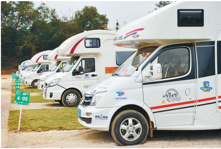
近日,全国各地的房车聚集在广西桂平西山泉露营地,参加第四届中国汽车(房车)露营大会。

据介绍,以汽车(房车)露营为核心的户外运动产业未来将有井喷式发展,下一步还将把汽车(房车)露营和装备制造结合起来,用智能化的思维和方式,发展房车、帐篷等户外运动性价比高的装备,满足普通老百姓的消费需求。(据新华社)