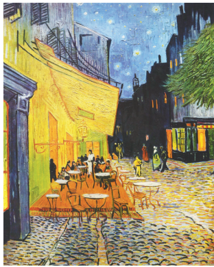
《夜晚的露天咖啡座》(油画) 梵高