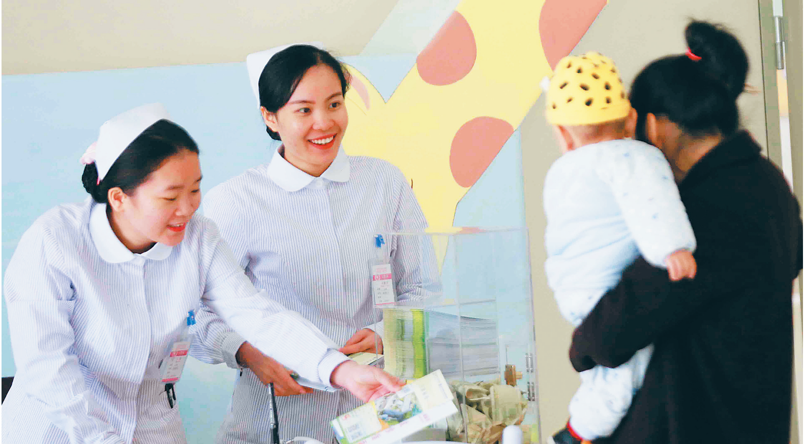
海南省儿童医院医护人员为患儿和家长提供咨询服务。

的前提下,复旦大学附属儿科医院海南分院利用复旦大学附属儿科医院所拥有的资源和平台,解决海南省儿科事业发展不平衡、不充分、历史欠账太多的问题,以满足全省群众对更高水准、更安全、便捷、经济的儿科医疗保健服务的要求。