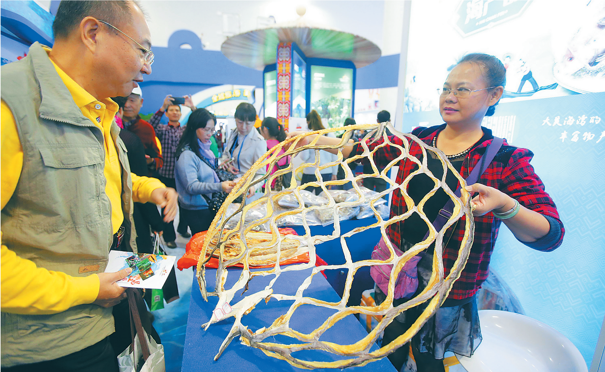
2016年(第十七届)海南国际旅游岛欢乐节国际旅游美食博览会现场,昌江展厅的工作人员展示鳗鱼产品。