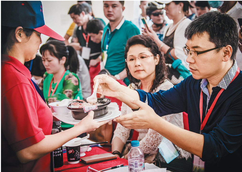
2015(第十六届)海南国际旅游岛欢乐节海南国际旅游美食博览会,“海南十大特色名菜、海南十大名小吃、海南琼菜十大名厨”总决赛现场。