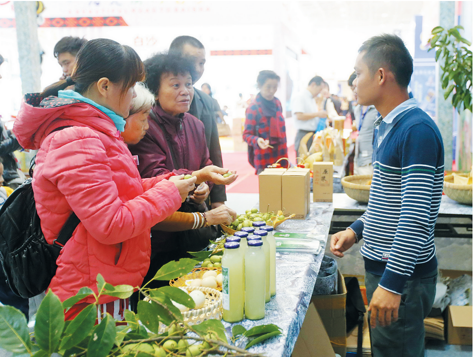
2015(第十六届)海南国际旅游岛欢乐节海南国际旅游美食博览会现场,市民游客品尝当地特色美食。