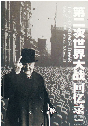
《第二次世界大战回忆录》