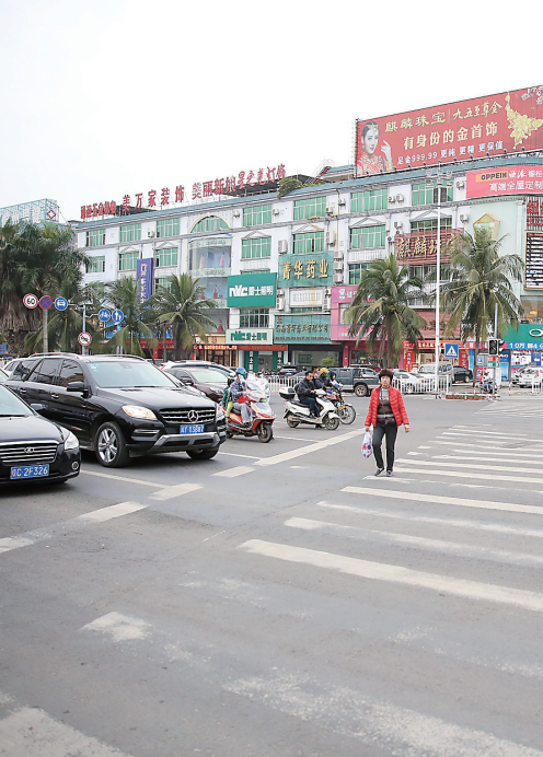
车辆礼让行人。

作为建设海南西部中心城市总抓手,儋州“一创五建”工作取得重大突破。近期国家住房和城乡建设部公布的2017年国家园林城市名单,儋州市榜上有名,成功创建“国家园林城市”。 贯彻省委、省政府区域发展战略布局,把儋州建成带动周边、辐射西部的区域性中心城市,2015年起,儋州市联动开展“一创五建”,以创建全国文明城市为统领,建设国家园林城市、国家卫生城市、全国双拥模范城、平安城市、创业创新城市活动,大力完善城市功能,着力优化城市秩序,努力提高城市品位,不断提升社会文明程度和市民幸福指数,打造宜居宜业宜游宜学环境,真正把儋州建设成为辐射西部、服务全省的西部中心城市。 以“一创五建”为总抓手,儋州全市上下增强紧迫感和责任感,创新思路,加大投入,建设“国家园林城市”率先取得突破。两年来,儋州城市园林绿化建设和维护资金投入超过4亿元。截至2016年底,建成区绿化覆盖率38.82%,绿地率34.16%,人均公园绿地面积15.35平方米。38个公园和游园绿地分布均匀,市民出行300米就能步入绿色空间,尽享绿色生活。儋州初步建成复合型、多层次、多功能的城市绿色生态体系。 以成功创建“国家园林城市”为契机,儋州将进一步鼓足创建干劲,加大创建力度,着力整治城市秩序,促进全市产业发展,全面提升城市品位、社会文明程度、市民幸福指数,创造宜居宜业宜学宜游的城市环境,努力实现儋州经济社会持续健康发展,力争2020年实现全部创建目标,谱写海南西部中心城市发展新篇章。