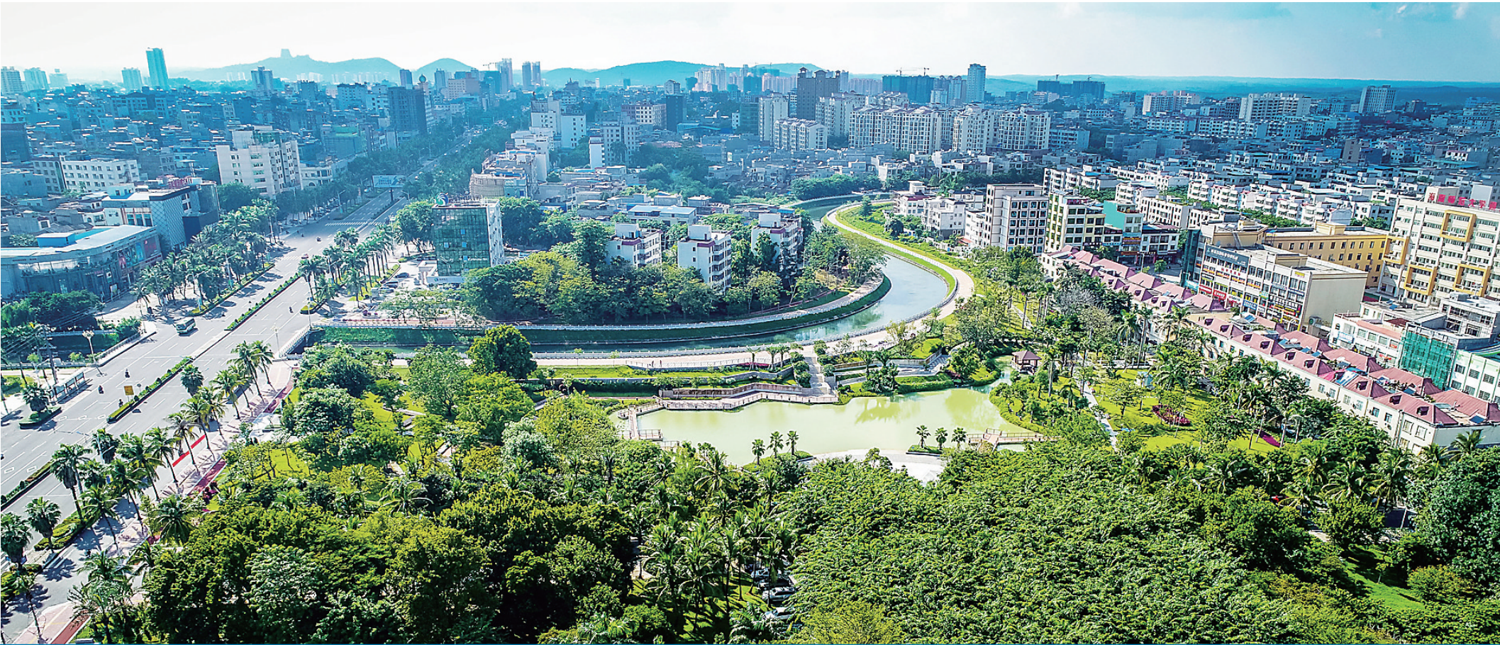
美丽的儋州城区。

儋州市升格地级市,建设西部中心城市,虽然时间不长,但城市变化很快很大。去年初,儋州提出举全市之力,以创建全国文明城市为统领,整体推进国家卫生城市、国家园林城市、全国双拥模范城、平安城市和创业创新城市建设,号召全市党、政、军以及各行各业广大干部群众掀起全民共建共享热潮。