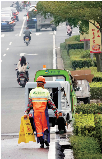
儋州市干净整洁的市容市貌少不了环卫工人的付出。

韦欢娥是儋州市和庆镇一名家庭妇女,她倾尽所有,用自家房子办起残疾人康复中心,给残疾人撑起一个温暖的“大家”,她的博爱精神让无数人为之动容。她儿子、儿媳们在她带动下,也积极投入到扶老助残公益事业。她家成为儋州闻名的扶老助残爱心家庭,被评为2017年全国“最美家庭”。 近年来,儋州涌现出一大批像韦欢娥一样的道德模范,如全国道德模