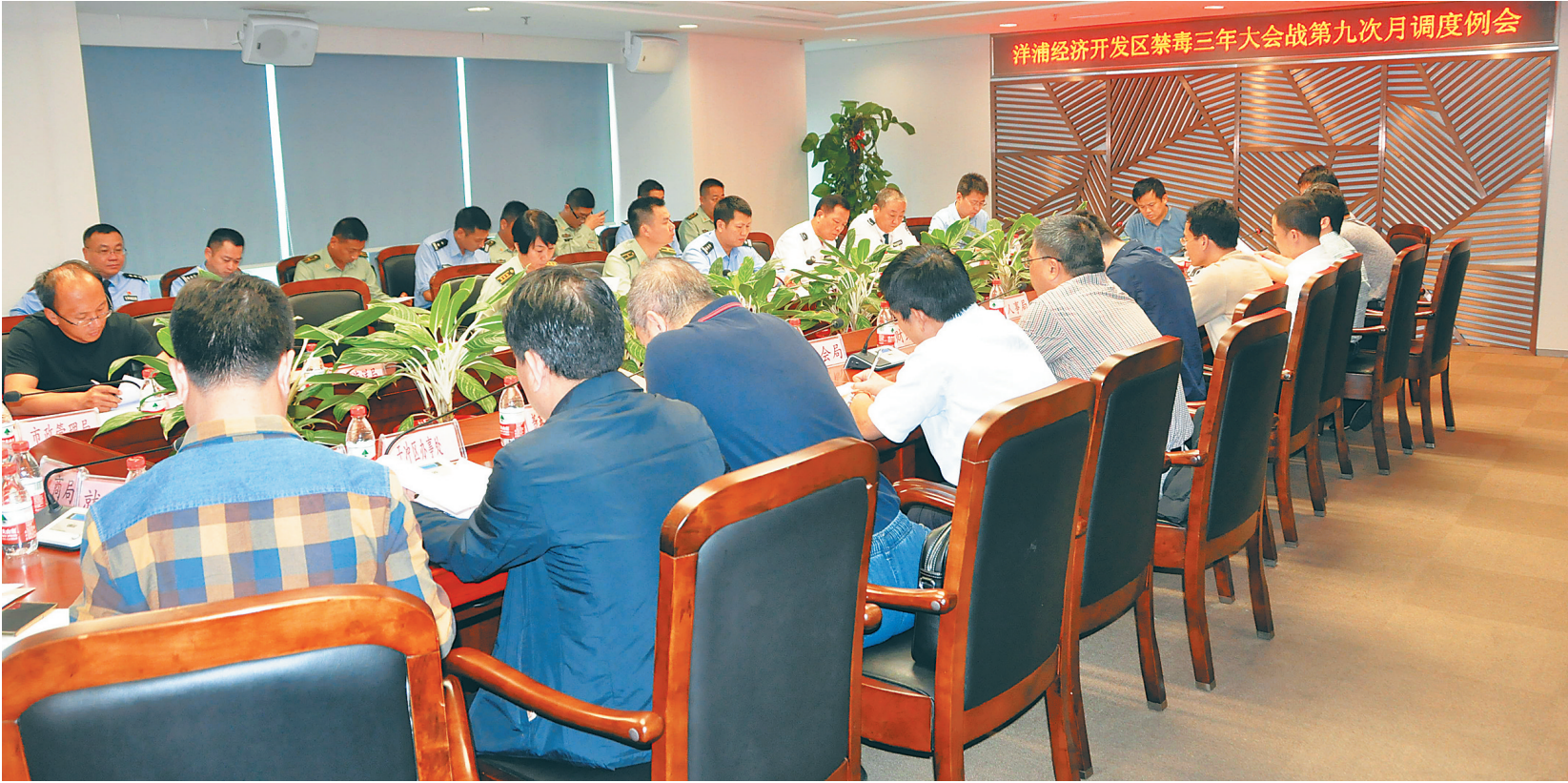
洋浦召开第九次月调度会,分析毒情形势,安排部署工作。