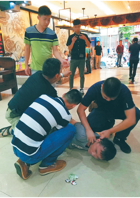
洋浦便衣警察抓获毒品犯罪嫌疑人。

据了解,由于漾月村坚持“有毒治毒创无毒,无毒防毒保净土”的原则,坚持做好堵源截流的禁毒工作方针,积极发动村民们参与,层层落实禁毒监管职责,连续10年12个自然村实现了“无毒村”达标率100%。