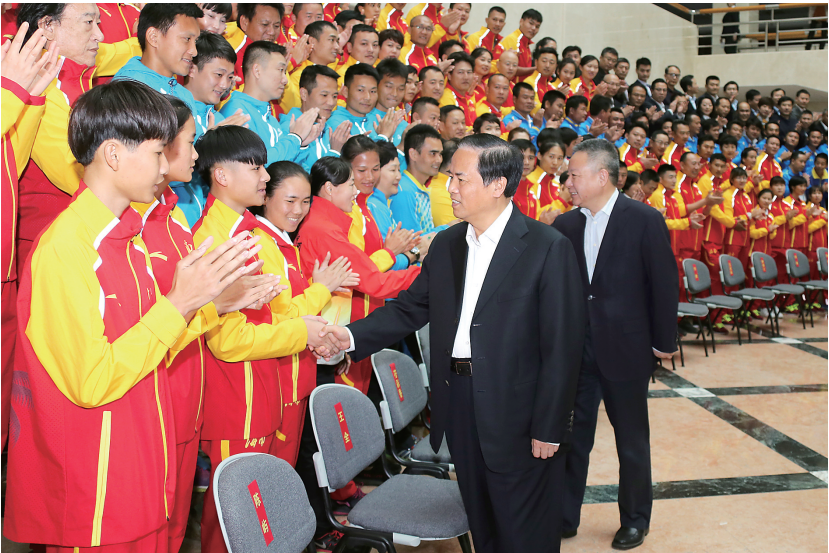
12月26日下午,海南省参加第十三届全国运动会总结表彰大会在海口举行。省委书记、省人大常委会主任刘赐贵,省委副书记、省长沈晓明会见了我省获奖运动员、教练员和体育“双先”代表。