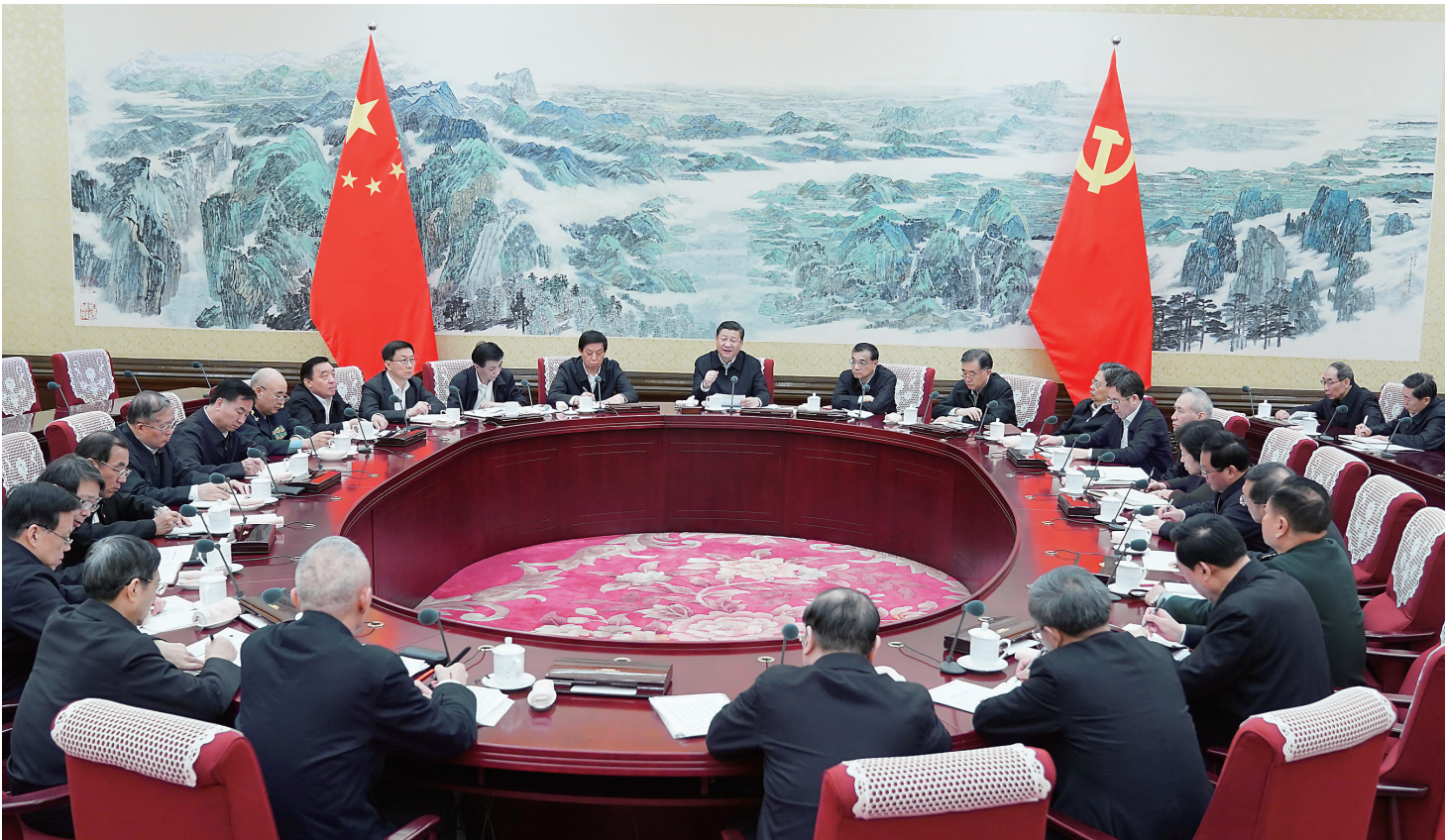
12月25日至26日,中共中央政治局召开民主生活会,中共中央总书记习近平主持会议并发表重要讲话。

新华社北京12月26日电 中共中央政治局于12月25日至26日召开民主生活会,以认真学习贯彻习近平新时代中国特色社会主义思想、坚定维护以习近平同志为核心的党中央权威和集中统一领导、全面贯彻落实党的十九大各项决策部署为主题,重点对照《中共中央政治局关于加强和维护党中央集中统一领导的若干规定》《中共中央政治局贯彻落实中央八项规定实施细则》,联系中央政治局工作,联系带头执行中央八项规定的实际,联系狠抓党的十九大决策部署的实际,进行自我检查、党性分析,开展