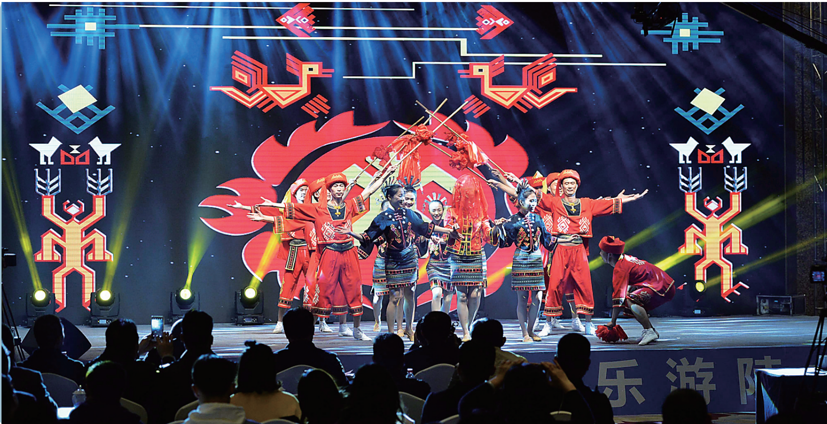
12月26日，“牵手苏南 美丽陵水”2017海南陵水全域旅游推介活动走进苏州，向苏州市民和旅游企业推介全域旅游产品。

苏州作为国家历史文化名城和风景旅游城市，陵水的到来为这里增添了大海般清新的气息。推介会上，陵水和平社区和苏州滕德社区举办缔结友好社区签约仪式、陵水联丰村和苏州袁家桥村举办缔结友好村庄签约仪式、陵水清水湾旅游区和徐霞客旅行社商会签署战略合作协议，多方面的合作让这两座相距千里的城市更加紧密联系在一起。