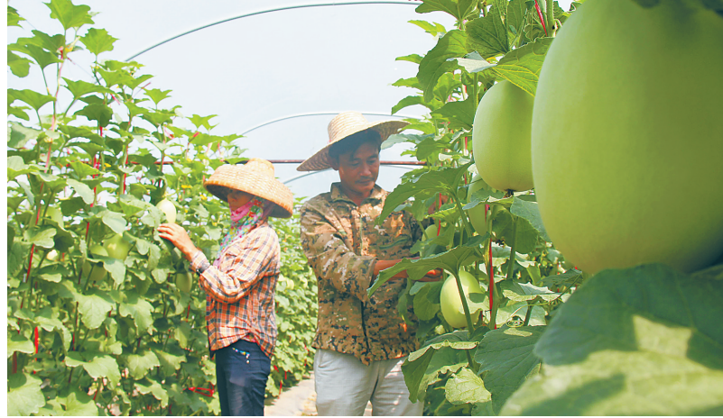
乐东佛罗镇利用福塘、青山等村的大棚哈密瓜种植专业合作社优势,引导贫困户加入合作社,进行产业扶持和就业帮扶脱贫。

扬帆新征程,乐东将坚持按照省委提出的“领导干部带头,党员带头,省直机关带头,在全省广泛深入开展