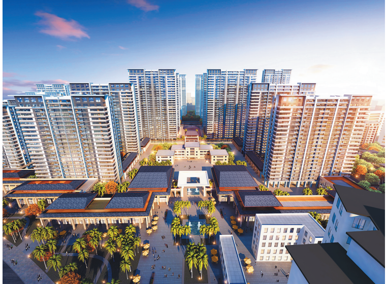
海府路某重点小区规划改造项目(正在规划报建)