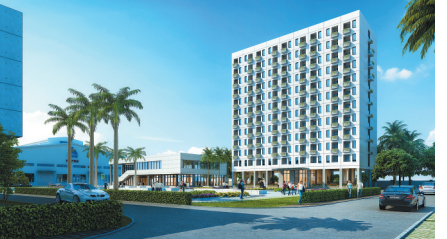
海建集团产业化海口(澄迈老城)基地宿舍楼生活区(已经建成)