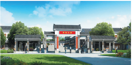
中瑞农场生产七队重建项目(正在规划报建)