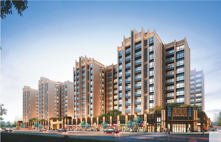
灵山·海建家园项目(正在建设)

研究小组研制出了符合国家规范要求的新型产品轻质隔墙板,具有质量轻、强度高、耗能少、多重环保、快速施工等特点,并将实现规模生产。 ● 2017年8月,我省首个装配式PC暨BIM技术专项应用高层住宅项目——海建家园开工建设。海建家园项目是海建集团自主开发的房地产项目,采用装配式施工工艺,也是省内首个应用装配式建筑的高层住宅示范项目。同时采用BIM技术全程对项目质量、安全、进度进行数字化科学化管理。此外,正在应用和准备应用装配式建造的项目还有海南老城经济开发区标准厂房工业园、省机关大院改造等住宅类项目,合同总造价超过100亿元。 ● 2017年11月,海建集团入选国家住建部认定的第一批装配式建筑产业基地,这是海南省唯一获批的企业,具有特殊的标志性意义,将为全国装配式建筑的发展起到示范和引领作用。