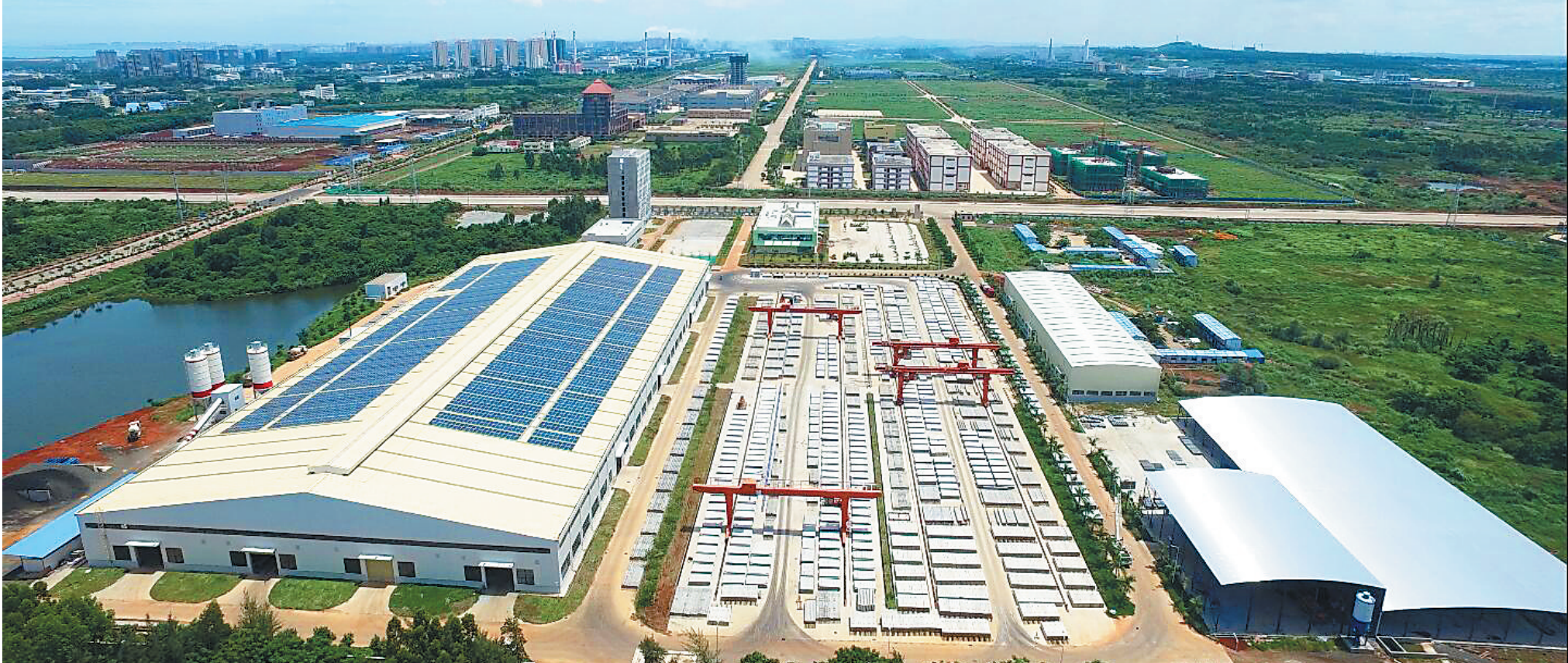
海建集团产业化海口(澄迈老城)基地全景

庆祝海南省建筑产业化股份有限公司通过香港QSPSC认证(预拌混凝土的生产和供应的质量系统)