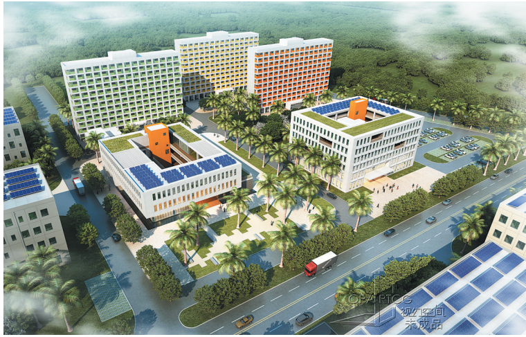
海南老城经济开发区标准厂房工业园项目(占地576亩,建筑面积47万平方米,正在建设)