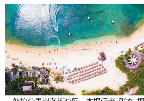
航拍分界洲岛旅游区。