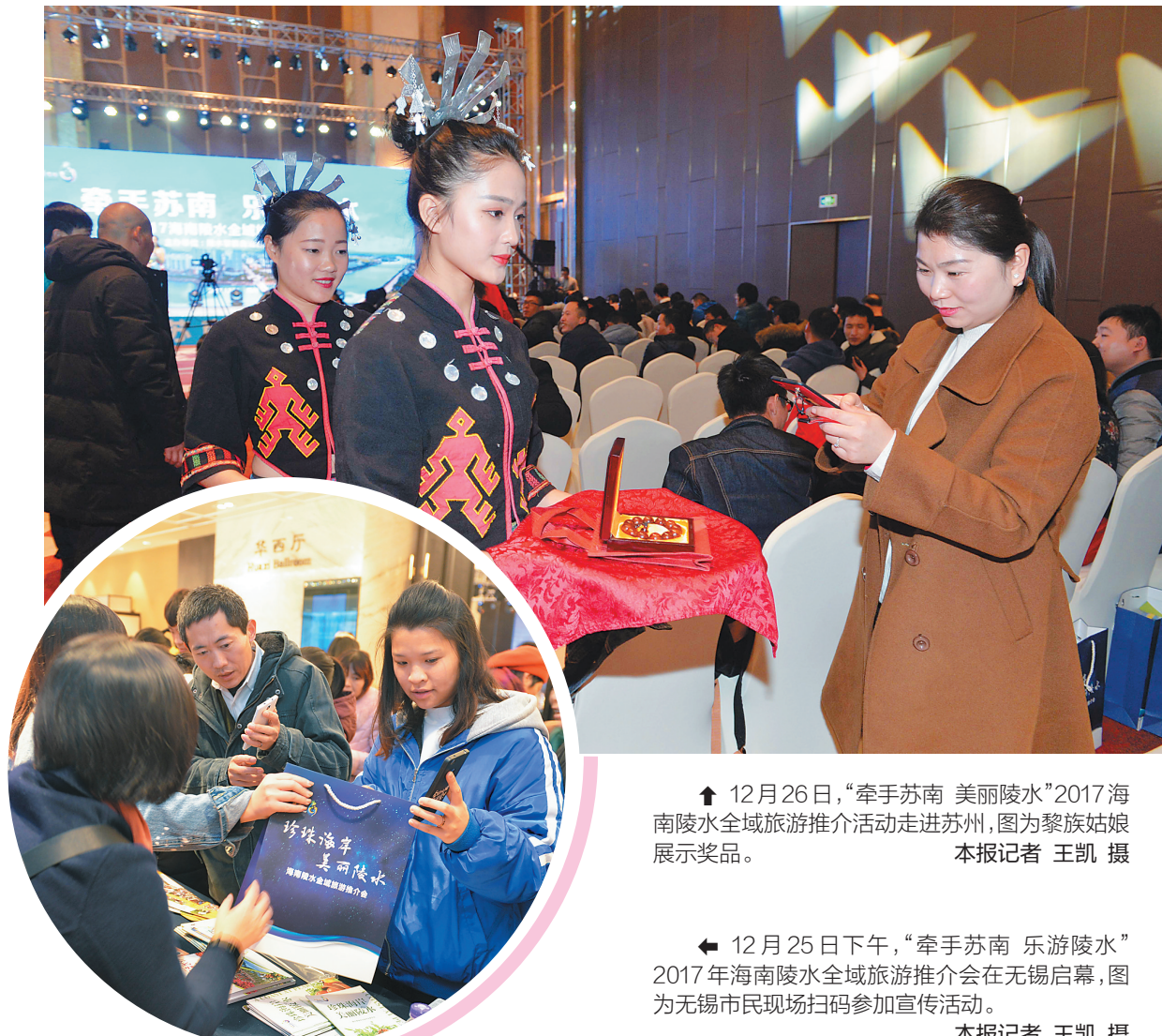
↑ 12月26日，“牵手苏南 美丽陵水”2017海南陵水全域旅游推介活动走进苏州，图为黎族姑娘展示奖品。