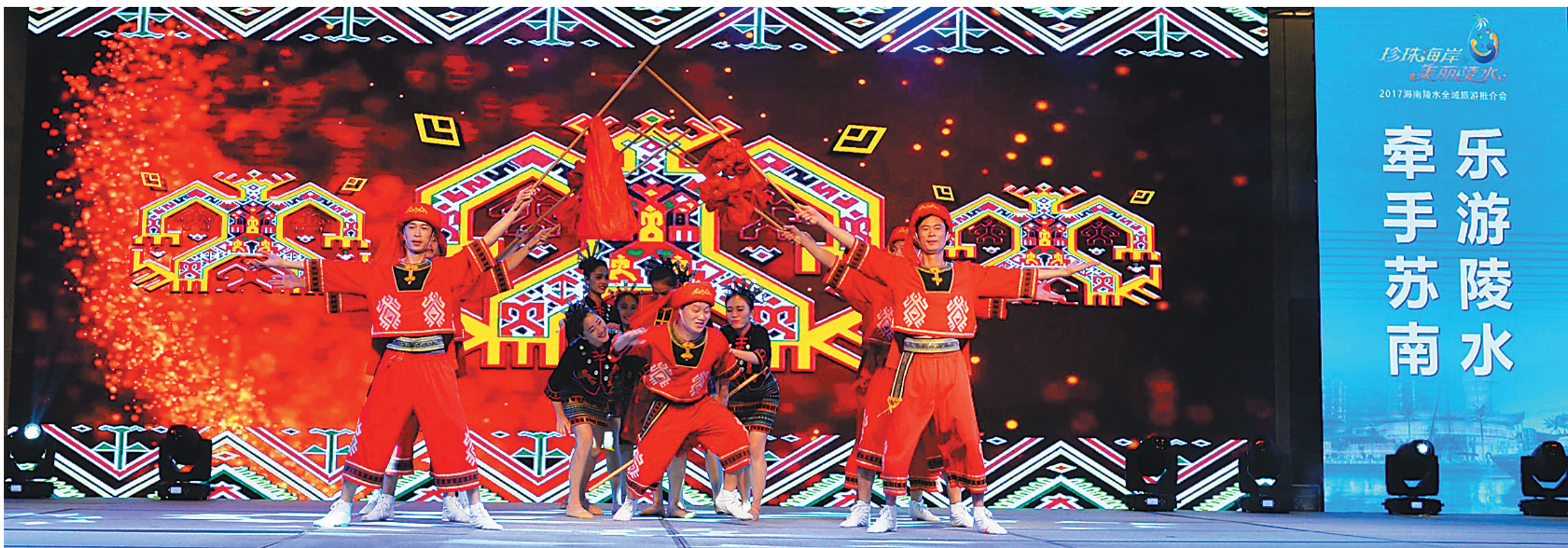
12月25日，“牵手苏南 乐游陵水”2017年海南陵水全域旅游推介会在无锡启幕，图为现场黎族歌舞表演。