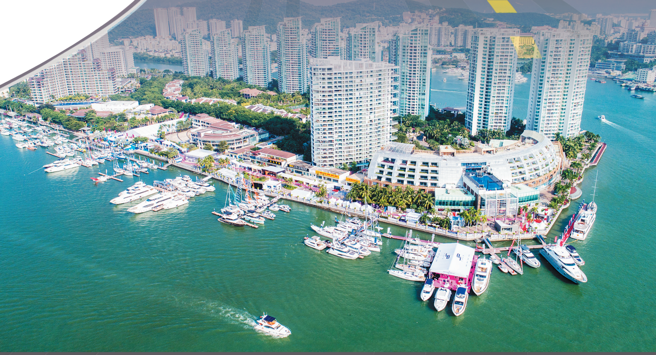
三亚借力邮轮、游艇等产业优势,积极培育本土活动品牌。图为2017年12月8日,“海天盛筵——2017第八届中国游艇、航空及高端时尚生活方式展”在三亚启幕。