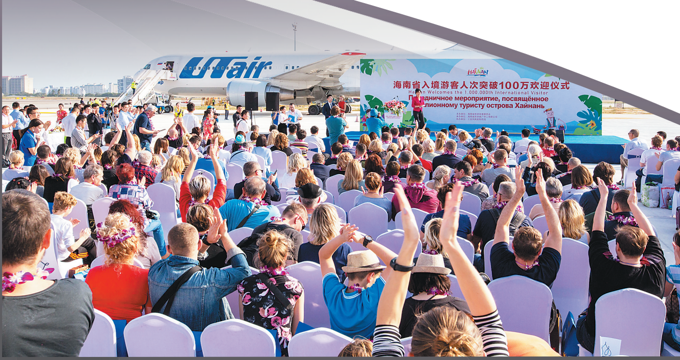
2017年12月6日,从俄罗斯莫斯科起飞的UT725航班,满载游客抵达三亚凤凰国际机场,标志海南省入境游客突破100万人次大关。