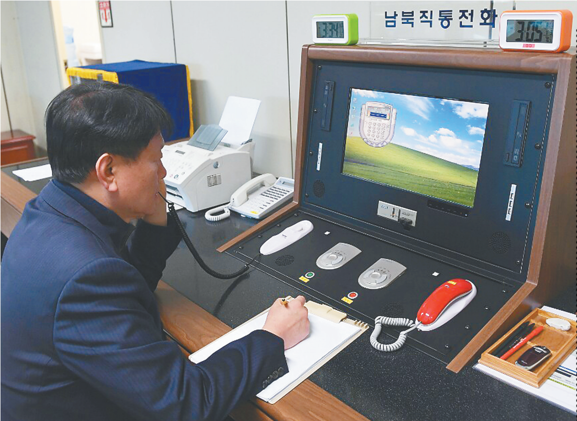
1月3日,在朝鲜半岛中部的板门店,一名韩国官员通过板门店联络热线与朝方通话。

哈克表示,联合国仍致力于确保安理会有关决议得到执行,希望更强大的外交努力能够帮助实现朝鲜半岛无核化目标。