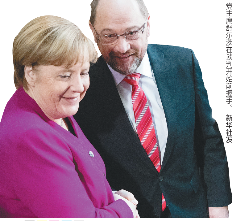
一月七日,德国总理默克尔(左)与社民党主席舒尔茨在谈判开始前握手。

德国总理安格拉·默克尔领导的联盟党与社会民主党7日开启为期5天的试探性组阁谈判。面临严峻政治压力的默克尔要靠什么打动勉强回到谈判桌前的社民党?英国《卫报》披露,社民党大佬暗示,只有联盟党交出财政大权,社民党才考虑加入大联合政府。面对这一苛刻要求,默克尔会点头吗?