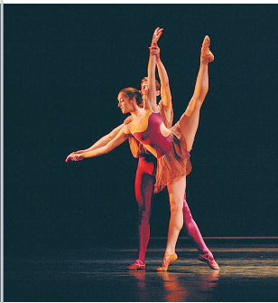
捷克歌剧院交响乐团海南上演精彩节目。