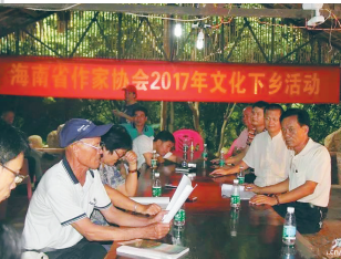
崖州民歌现场演唱。

全景解读为理念,从上海博物馆、景德镇市陶瓷考古研究所、扬州市文物考古研究所及上海硅酸盐研究所、海南省博物馆等单位馆藏中遴选了50余件代表文物参展,观众可借此了解中国青花瓷循着古代海上与陆上丝绸之路走向世界各地的路径轨迹,探寻青花瓷外销的盛况及其背后的故事。