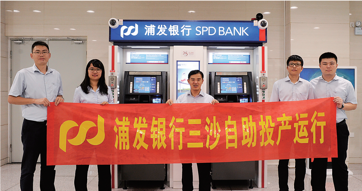
2017年11月22日,浦发银行海口分行三沙市永兴岛机场ATM自助服务点投产运行。

2018年1月9日,浦发银行迎来25周年华诞。她用25年的时间取得了股份制银行平均30年发展才能取得的辉煌成就,成功进入全球银行1000强前30位,进入《财富》世界500强榜单;实现了由中小型银行向大中型银行的跨越,由单一资金中介的传统商业银行向提供全面金融服务金融集团的突破,形成了以银行为主体的集团化发展格局;实现了“立足上海、辐射全国、走向世界”的机构布局;市场竞争力、品牌价值和社会影响力持续提升,可持续发展能力显著增强。