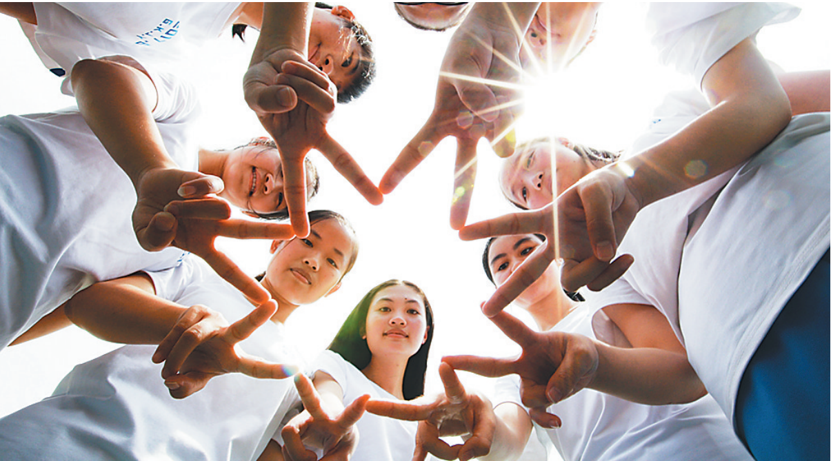
到2020年,我省将普及高中阶段教育。

本报海口1月8日讯(记者陈蔚林 实习生卢选梅)省教育厅、省发改委、省财政厅、省人社厅、省编办今天印发《海南省高中阶段教育普及攻坚实施方案(2017—2020年)》(以下简称《实施方案》),明确到2020年,全省普及高中阶段教育,高中阶段毛入学率达到92%以上,略高于全国目标。 《实施方案》要求,各地各部门要着力提高教育基础薄弱市县特别是高中阶段教育毛入学率较低地区的普及程度;要合理规划学校布局,有效利用高中教育资源,方便学生在县域内就学;要完善学校办学标准,加强学校办学条件建设,完善和落实学生资助政策,不让一名学生因家庭经济困难而失学。 到2020年,全省高中阶段在校生约34万人,毛入学率达到92%以上。普通高中与中等职业教育招生规模大体相当,结构更加合理;学校办学条件明显改善,满足教育教学基本需要;经费投入机制更加健全,生均拨款制度更加完善;教育质量明显提升,办学特色更加鲜明。 为了合理布局高中阶段教育,《实施方案》要求,各地各部门要根据人口变化趋势和办学实际,科学预测,统筹规划本地高中阶段学校;要整合中等职业学校教育资源,整合一批弱、小、散、冗的中等职业学校,推动中等职业教育资源向优质学校集中;要支持高中阶段民办学校发展,把高中阶段民办教育纳入本地基础教育发展规划统筹考虑、合理布局,鼓励民办高中、中职招收残疾学生。 为了扩大高中阶段教育资源,《实施方案》要求,各地各部门要继续