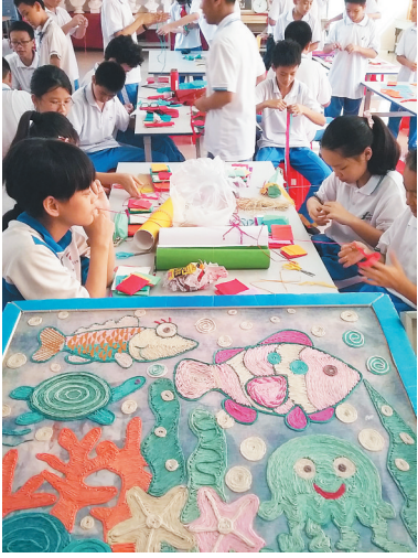
学生们在纸泥画课中感受美术的魅力。