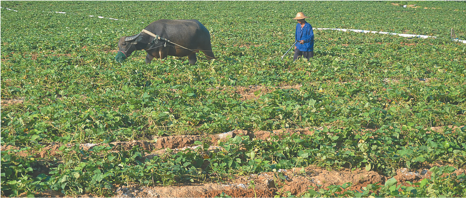
农户在田间牛耕松土