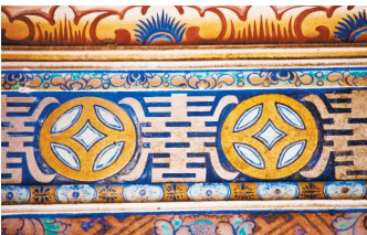
文昌市韩家宅壁画。