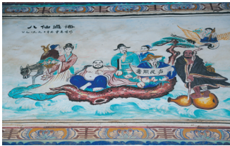
文昌铺前镇地太村村庙内的壁画。