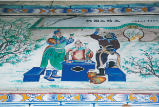
文昌铺前镇地太村村庙内的壁画。