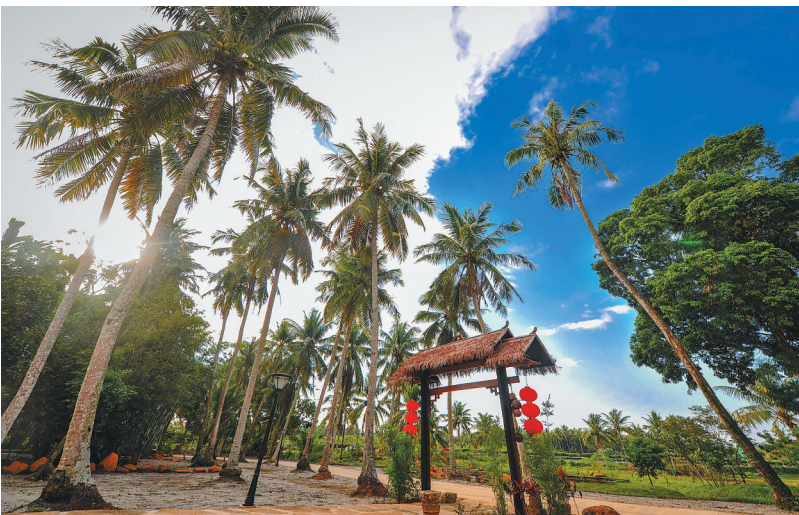
乡村游是发展全域旅游的重要抓手。图为文昌潭牛镇大庙村。本报记者 袁琛 摄

使馆提醒赴泰中国公民严格遵守电子烟相关法律规定,避免引起不必要的麻烦,确保旅行顺利。(李辑)