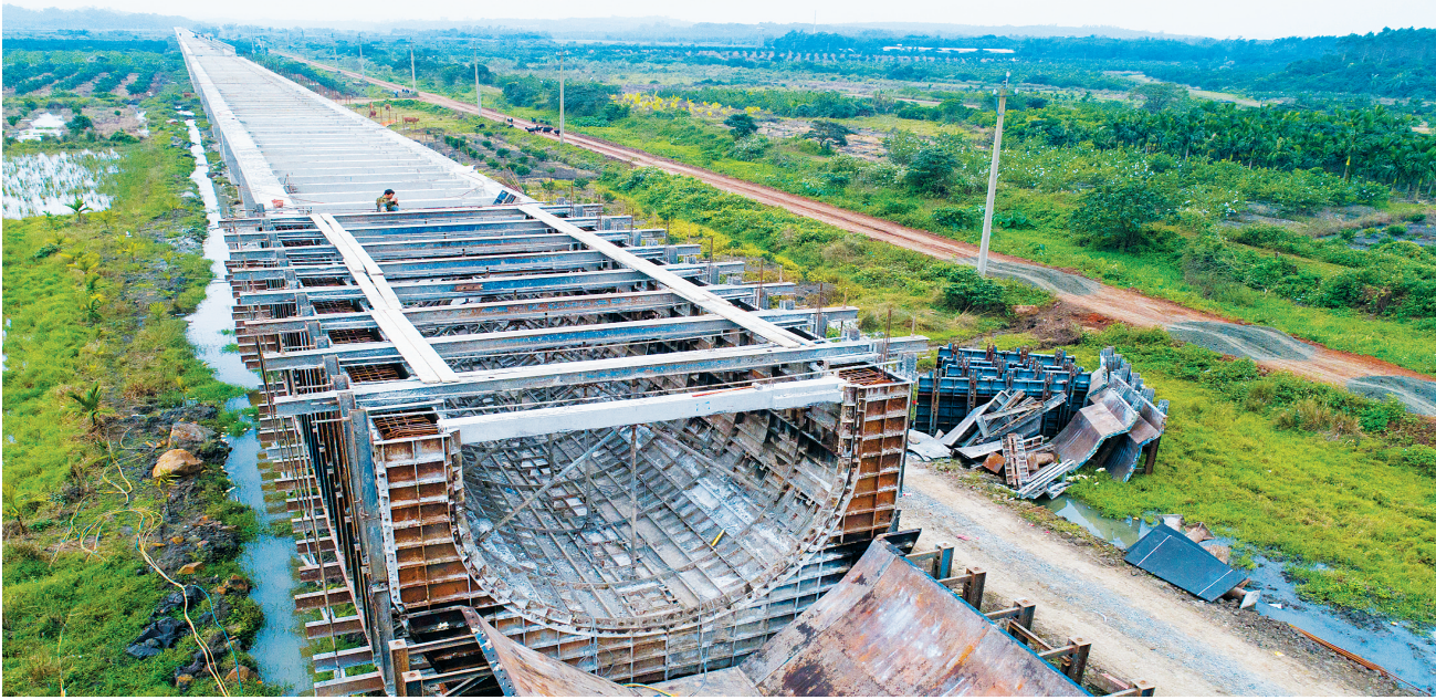
日前,在红岭灌区海口琼山区大坡镇田心村段渡槽施工现场,工人正在加紧施工。灌区设计线路总长约518公里,涉及6个市县。目前该项目已累计完成投资超过41.48亿元,占总投资的71.9%,主体工程有望于明年底具备试通水条件。

近年来,袭警、辱警事件之所以频繁发生,原因很多,但一些地方不敢理直气壮地为民警依法履职“撑腰打气”也是原因之一。之所以“不敢”,客观上固然有一些群众漠视法律带来执法难度增加的因素,但更不能忽视主观上一些地方回避矛盾、不愿担当,在该依法果断处理时不敢“依法”、不敢“果断”,反而助长了以闹谋利的歪风邪气。 因此,保护基层一线民警的依法履职必须理直气壮。我们必须承认,现实中存在着一些执法不规范、甚至滥用执法权的现象,这应当发现一起纠正一起,不留余地;但对于依法履职的,应当坚决保护,不能含糊。执法法是法治得以施行的关键,如果纠正不力是失职的话,那么保护和支持不力也是失职。 敢于“撑腰”的同时,也必须善于“撑腰”。“撑腰”不仅仅意味着对袭警辱警人员严肃追究法律责任,更重要的是在涉警舆情发生时,要懂得如何有效回应公众关切。公众舆论欢迎的是客观权威、公开透明,只要能第一时间及时调查、主动澄清,不仅不会造成负面影响,反而让民警的依法履职能得到公众更多理解和支持,也给社会上上了一堂生动的法治课。(张璁) (摘编于1月17日《人民日报》)