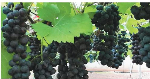
我省种植的葡萄迎来丰收。

省农业厅相关负责人表示,保障农产品质量安全,要切实把好农药产品流通的源头关,各级农业执法部门将定期或不定期联合相关部门,对物流企业开展农药联合执法专项整治。