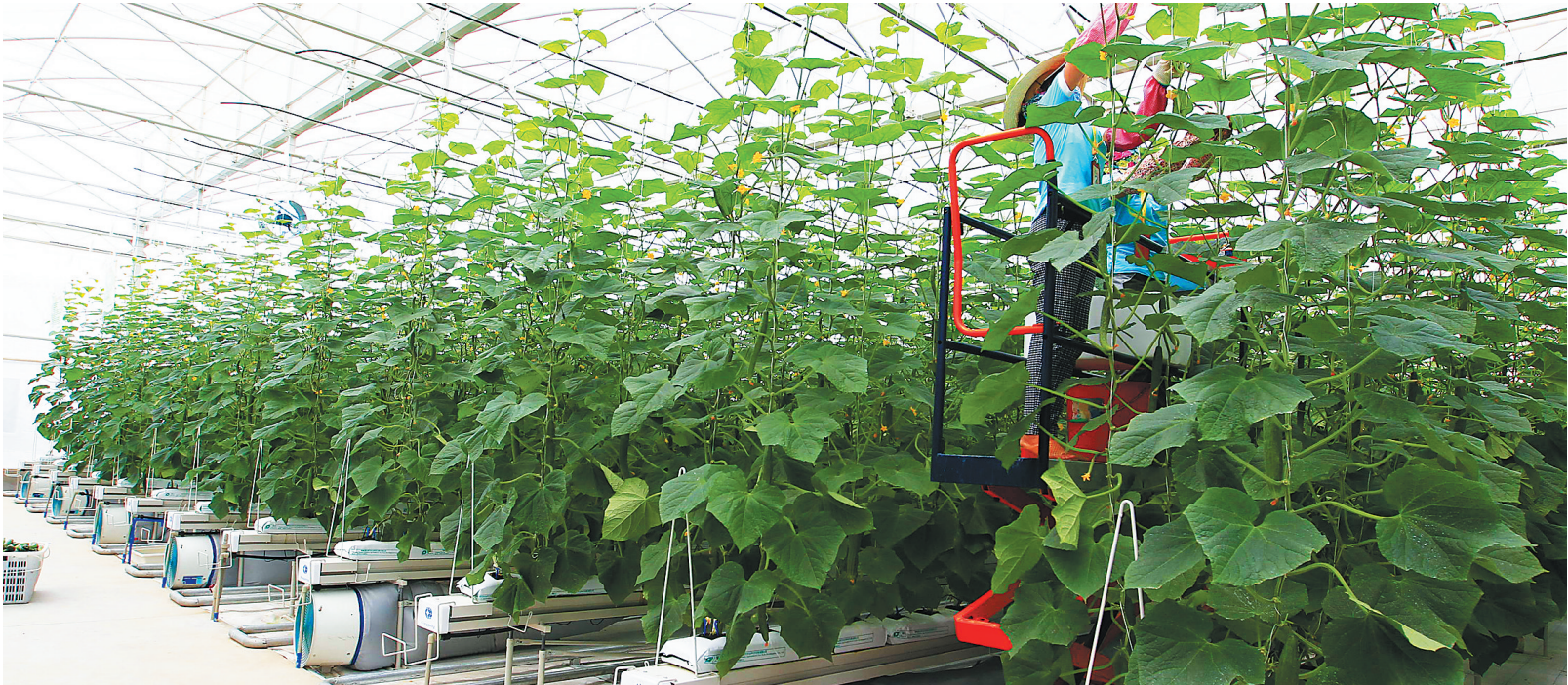
陵水现代农业科技示范基地。