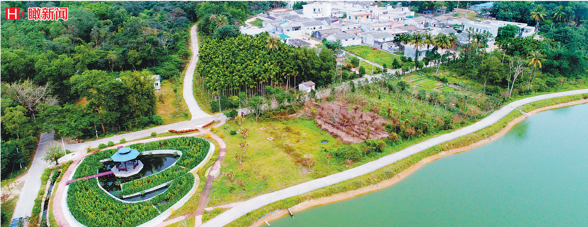
1月16日,俯瞰美景如画的澄迈县金江镇宋岭村。宋岭村所建的污水处理池净化了村庄环境。

‘澄迈县创业孵化基地’‘澄迈县青年创业协会’等平台,青年创业者可以相互交流学习、分享经验。”澄迈县委组织部相关负责人表示。 对于大学生返乡创业的资金难题,该负责人透露,返乡大学生通过无偿资助或资金奖励,使创业项目发展达到一定规模时,可由“澄迈县鼓励和扶持返乡大学生自主创业工作领导小组”协调澄迈县科技、农业发展资金,进行对口支持和协调商业金融机构进行贴息贷款,以鼓励创业项目做大做强。