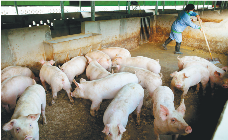
1月16日,饲养员在金江镇高山朗村澄迈众富种养农民专业合作社清洗猪舍。

地入股合作社,以“集体合作社+扶贫资金+贫困户”与海垦畜牧公司合作,依托公司专业化养殖技术发展生猪养殖带动贫困户增收,全村贫困户在2017年底就分红50万元。同时,公司还在村里招工,每天80元的工资让贫困户持续增收。 “一人脱贫,激发了其他贫困户脱贫的意愿。”高山朗村党支部书记徐文晖说,截至2017年底,高山朗村17户贫困户全部脱贫,仅剩2户贫困户12人处于巩固提升阶段,今年也可全部脱贫。 高山朗村的脱贫出列是澄迈县脱贫攻坚工作的一个缩影。2017年,澄迈县还有金江镇塘北村、山口村,永发镇赛玉村、加乐镇加朗村等4个村实现了脱贫出列。 除了推进产业、乡村旅游、就业等一系列扶贫方式外,澄迈县还积极推进电商扶贫,已建成并投入运营的村级电商服务站256个,实现贫困户全覆盖;加强基础设施扶贫,开展交通扶贫六大工程建设;全面实施教育扶贫,资助建档立卡学生7908人次,资助金额918.255万元;