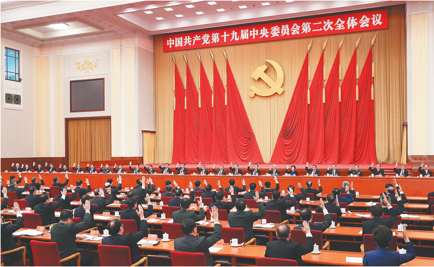
中国共产党第十九届中央委员会第二次全体会议，于2018年1月18日至19日在北京举行。中央政治局主持会议。

新华社北京1月19日电 中国共产党第十九届中央委员会第二次全体会议公报 （2018年1月19日中国共产党第十九届中央委员会第二次全体会议通过） 中国共产党第十九届中央委员会第二次全体会议，于2018年1月18日至19日在北京举行。 出席这次全会的有，中央委员203人，候补中央委员172人。中央纪律检查委员会常务委员会委员和有关方面负责同志列席会议。党的十九大代表中部分基层同志和专家学者也列席会议。 全会由中央政治局主持。中央委员会总书记习近平作了重要讲话。 全会审议通过了《中共中央关于修改宪法部分内容的建议》，张德江就《建议（草案）》向全会作了说明。 全会一致认为，党的十九大和十九届一中全以来，在以习近平同志为核心的党中央坚强领导下，全党全国把学习宣传贯彻党的十九大精神作为首要政治任务，深入开展多种形式的学习宣传活动，兴起了学习贯彻党的十九大精神、习近平新时代中国特色社会主义思想热潮，为贯彻落实党的十九大提出的各项战略决策和工作部署提供了强大精神动力，全党全国各族人民思想更加统一、信心更加坚定、行动更加有力，党和国家各项事业呈现欣欣向荣的发展局面。 全会认为，宪法是国家的根本法，是治国安邦的总章程，是党和人民意志的集中体现。现行宪法颁布以来，在改革开放和社会主义现代化建设的历史进程中、在我们党治国理政实践中发挥