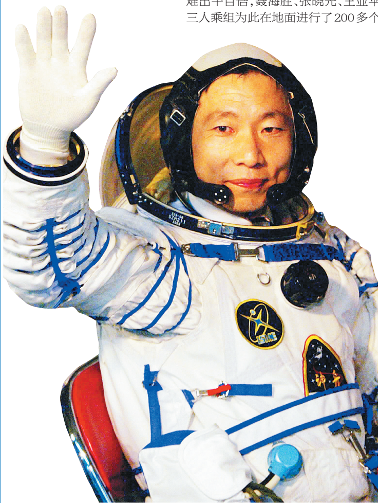
2003年10月15日，执行中国首次载人航天飞行任务的航天员杨利伟出发登舱前挥手致意。