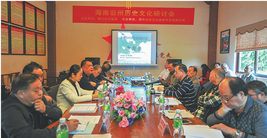
1月21日，海南旧州文化历史研讨会上，专家学者们踊跃发言。

近中午时分，众位专家学者仍就其中细节进行着热烈的讨论，观点或有差异，但研究问题的务实精神及对海南历史文化的热爱却并无二致。