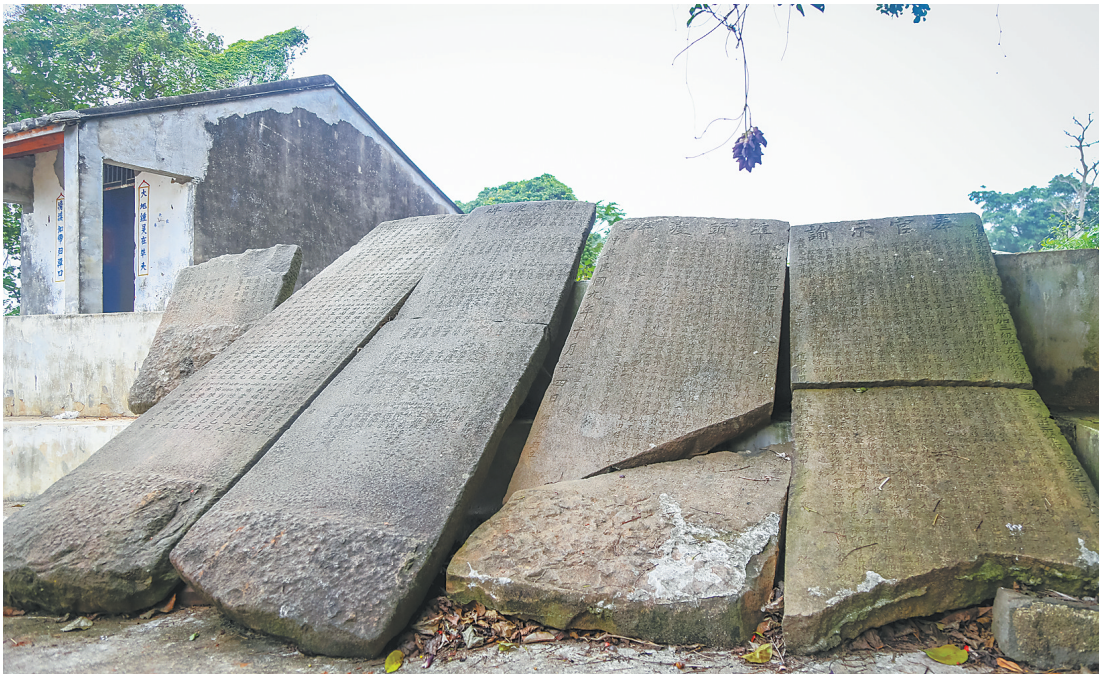
旧州古城渡口旁的古代石碑